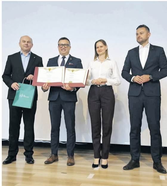
Gmina otrzymała 255 tys. dotacji z województwa

To kolejny przykład udanej współpracy między samorządem województwa, powiatem a gminą na rzecz poprawy infrastruktury drogowej i jakości życia mieszkańców. Mieszkańcy Ostrowiny mogą wreszcie jeździć nową, komfortową drogą!