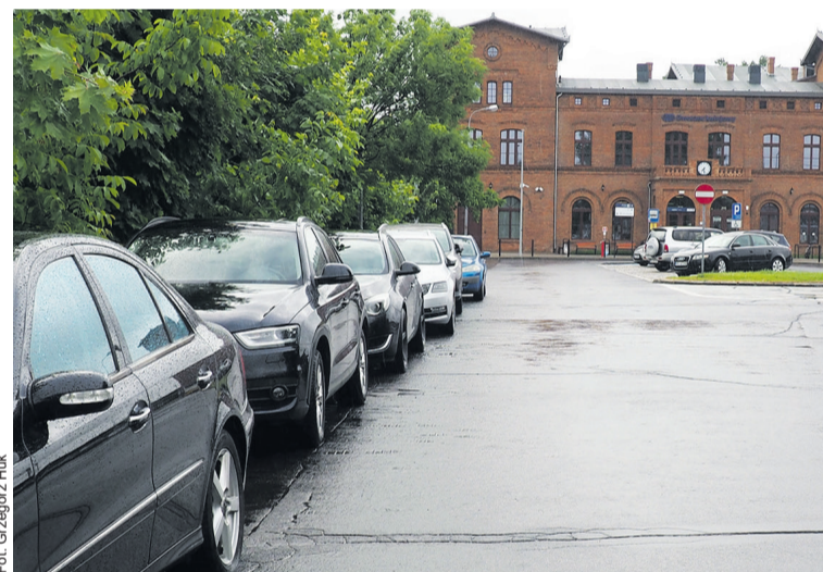
Stanąc autem coraz trudniej

Miasto w odpowiedzi dla radnego PiS stwierdziło, że sprawa nie leży w jego kompetencjach. Droga Kolejowa i tereny przyległe do