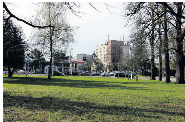
Czy to docelowa lokalizacja ośrodka?

Lokalizacja przychodni będzie zależać od wysokości pozyska-