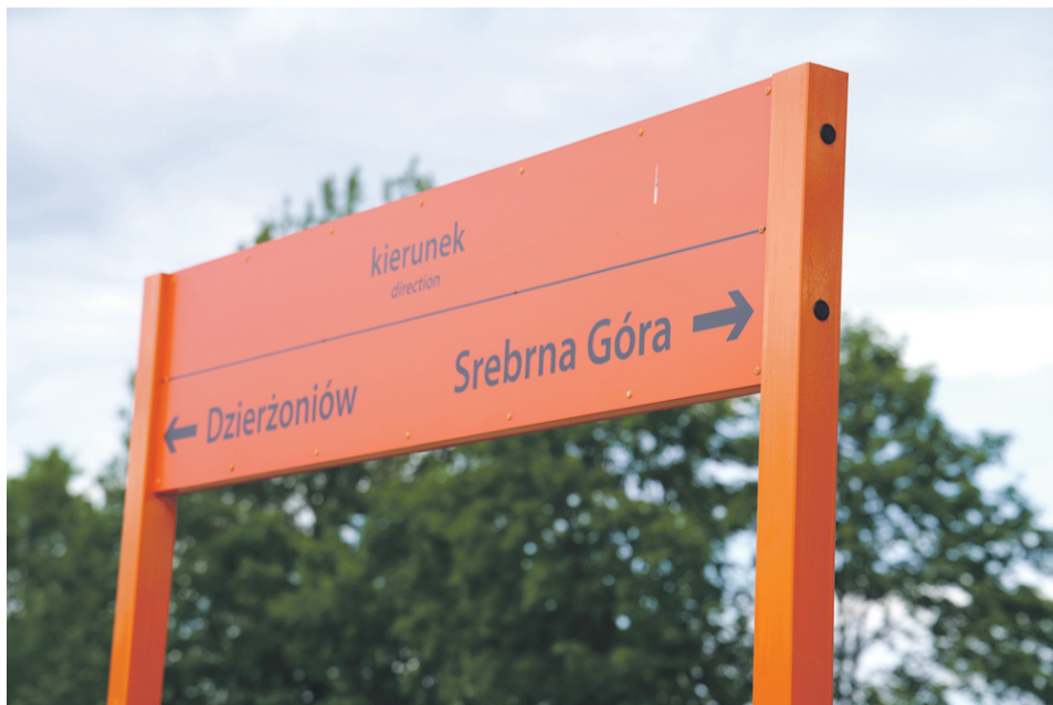
Jeszcze w tym roku ma zakończyć się rewitalizacja dalszej części linii kolejowej nr 318 - do Srebrnej Góry