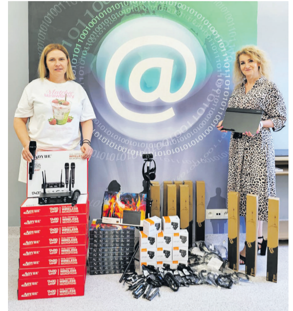
Do szkół Gminy trafiły 64 nowoczesne zestawy sprzętu komputerowego