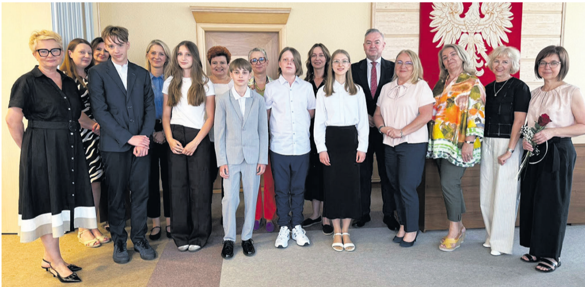
Zasłużyli na laury

Gospodarz Oleśnicy zaprosił do ratusza laureatów najważniejszych konkursów.