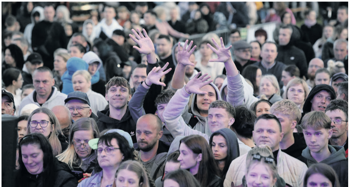
Ulewa ich nie przstraszyła