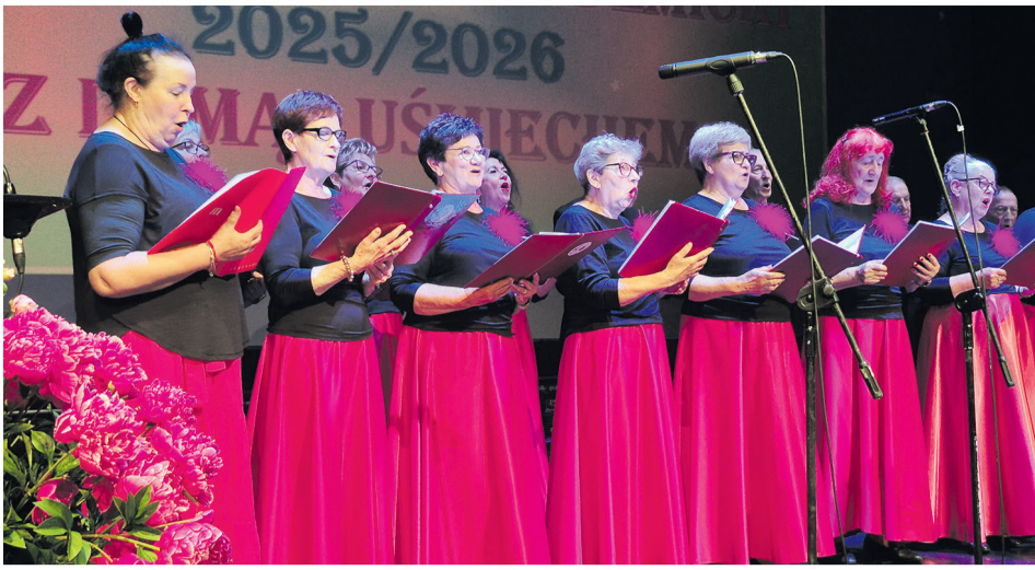
Chór Canorus zawsze wypada... śpiewająco