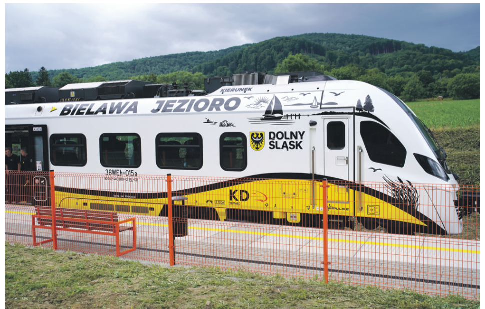
Dzięki rewitalizacjom i przywracaniu połączeń kolejowych organizacja wakacyjnych podróży staje się jeszcze łatwiejsza