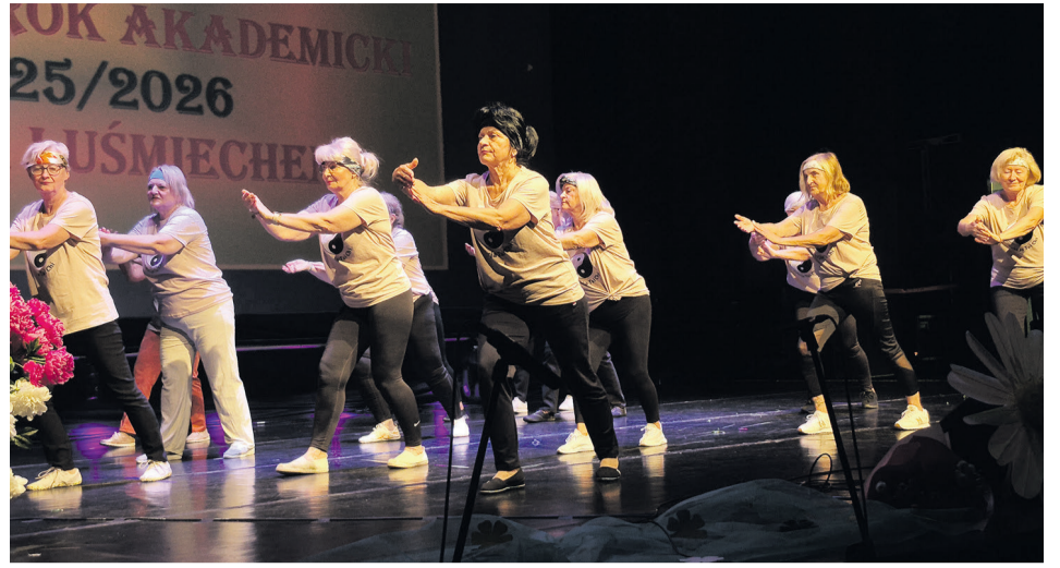
Tai chi - ruch, który uspokaja