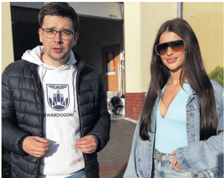
Roxi zapozowała do zdjęcia z burmistrzem