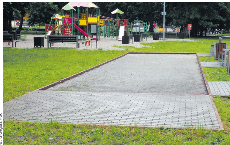
Przestał już cieszyć