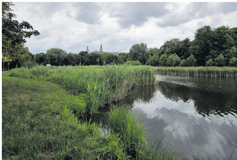
Prace ruszą dopiero zimą