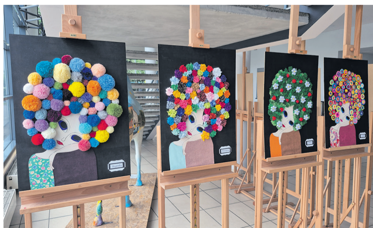
Powstały piękne prace

kom: zawodowym, rodzinnym, domowym. Może nie mieliśmy czasu, siły, pomysłu, materiałów czy motywacji a może po prostu nie było takiej potrzeby? Dziś, korzystając z pomocy i wsparcia pracowników Dziennego Domu Senior+ Miejskiego Ośrodka Pomocy Społecznej w Oleśnicy, staliśmy się autorami tych barwnych i różnorodnych prac. Obrazy, które można oglądać na tej wystawie, powstały w czasie piątkowych dwugodzinnych warsztatów plastycznych pod