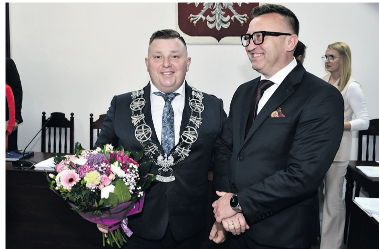
Z gratulacjami dla wójta

Raport pokazał również dużą aktywność władz gminy w zakresie komunikacji z mieszkańcami. W 2025 roku odbyło się 220 spotkań wójta z mieszkańcami, w tym 28 z przedsiębiorcami.