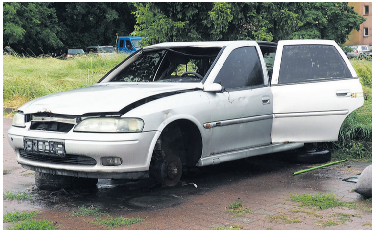
Taki obrazek to powód do wstydu

Gdzie? Na parkingu Biedronki. Radny składa interpelację.