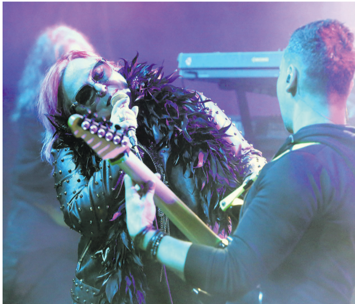
Przeżywali to z Lombardem