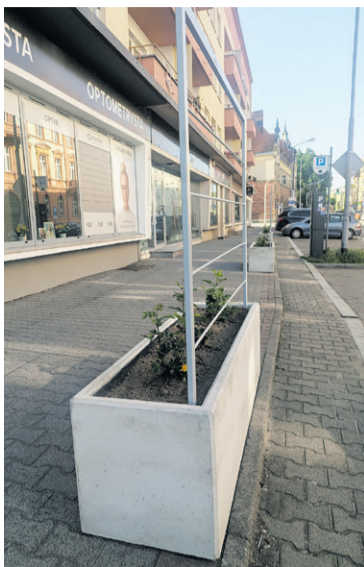
Radny to sprawdza

Radny opozycyjnego klubu Oleśnica Razem wnosi o: przedstawienie dokładnych kosztów obu etapów inwestycji; okazanie ze-