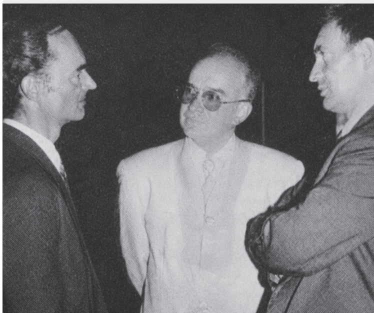
Wystarczyła jego uważność...