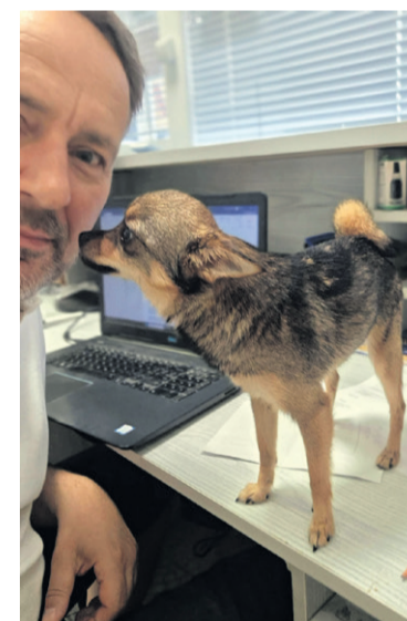
Robota od razu idzie łatwiej

Publikacja szybko spotkała się z ciepłym odbiorem internautów, którzy nie szczędzili sympatycz-