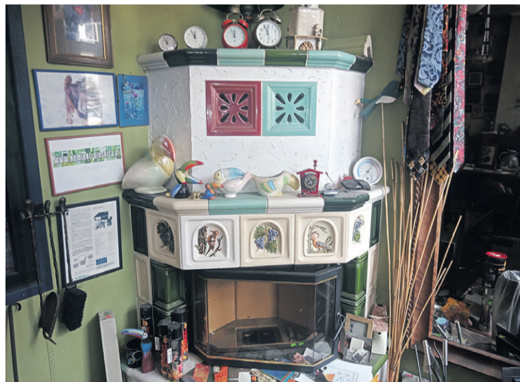
I kominki, i przedmioty vintage do kupienia za pół ceny

Sklep przez lata zasłynął nie tylko z oferty kominków, ale także z bogatej kolekcji przedmiotów vintage i antyków. Wśród nich znajdują się stylowe lampy z lat 50. i 70., zegary, akwarele, zabytkowe biurko oraz wiele innych kolekcjonerskich przedmiotów. One również są przeznaczone na sprzedaż. Wyprzedaje obejmuje więc nie tylko wyposażenie związane z kominkami, ale także wiele unikatowych przedmiotów, które mogą zainteresować kolekcjonerów i miłośników designu z minionych dekad. (OAI)