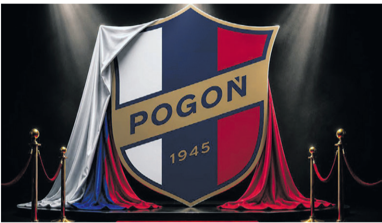
Autorem herbu jest Michał Ruchel

„Jeżeli drużyna będzie się rozwijać i grać piłkę, na jaką Oleśnica zasługuje, to nikt nie będzie miał wątpliwości, z jakiego miasta przyjechała Pogoń po kolejne trzy punkty. Dla mnie może być tam nawet Pan Bronś na jednorozczu. Ostatecznie i tak najważniejszy jest