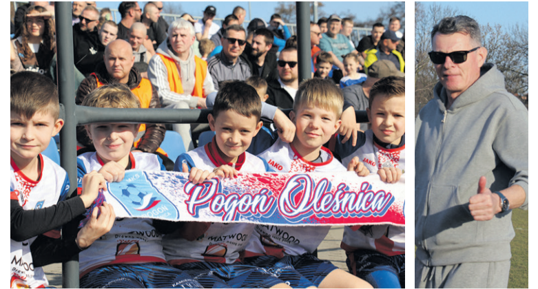
Oni liczą na awans.

Przygotowania do nowego sezonu rozpoczną się 16 lipca. W planach znalazło się pięć meczów sparingowych. Rywalami Pogoni będą kolejno: KP Słupia, Orzeł Pawłowice, Polonia Miłoszyce, Czarni Chrzastawa oraz Wratislavia.