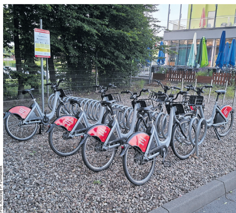
Czeskie rowery odjeżdżają

Na tym jednak spór się nie zakończył. Roovee publicznie twierdziło, że Rekola nie spełnia aż 15 wymagań określonych w specyfikacji przetargowej. Na portalu olesnica24.com ukazał się sponsorowany materiał przedstawiający zastrzeżenia wobec nowego operatora.