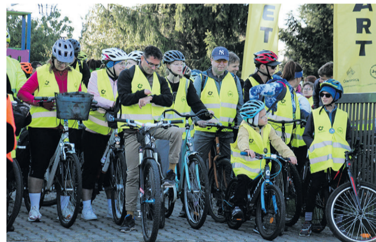
Gotowi do startu?

Ale najpierw zapiszcie się na XXXIV Oleśnicki Rajd Rowerowy. Do wygrania rowery i atrakcyjne nagrody.