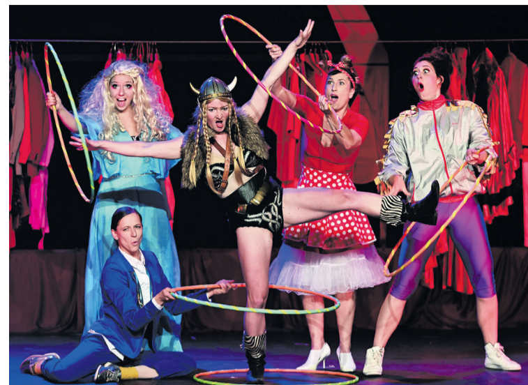
Barbaren Barbies o damsko-męskich stereotypach

Barbaren Barbies (Niemcy) - „A Wild Women Circus” w żółtym namiocie na błoniach zamkowych. Pięć artystek w energetycznym, humorystycznym widowisku, które z przymrużeniem oka rozbija damsko-męskie stereotypy.