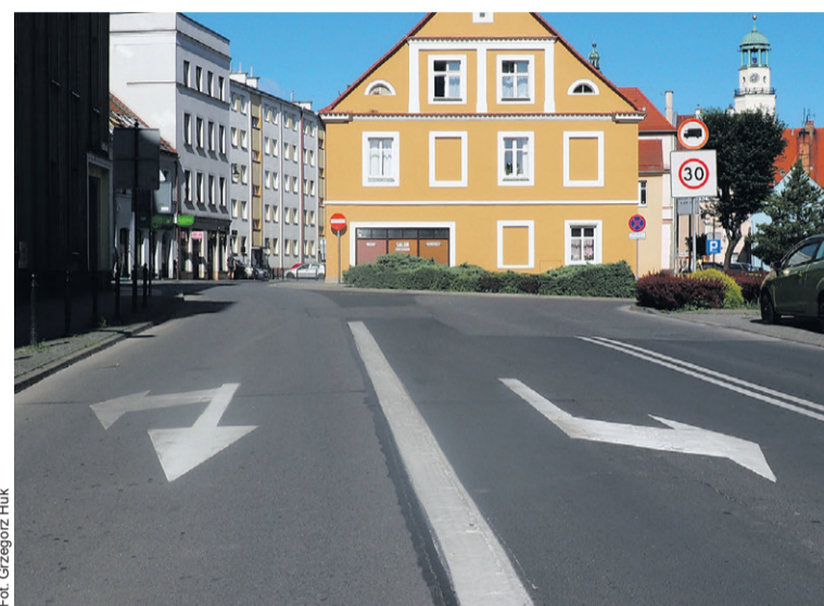
Od razu ładniej i lepiej...

Dzięki temu kierowcy zyskali wyraźniejsze i czytelniejsze oznaczenia dróg, pasów oraz parkingów, co powinno poprawić bezpieczeństwo i komfort poruszania się po mieście. Prace zostały zrealizowane jeszcze przed wakacyjnym szczytem ruchu. (OAI)