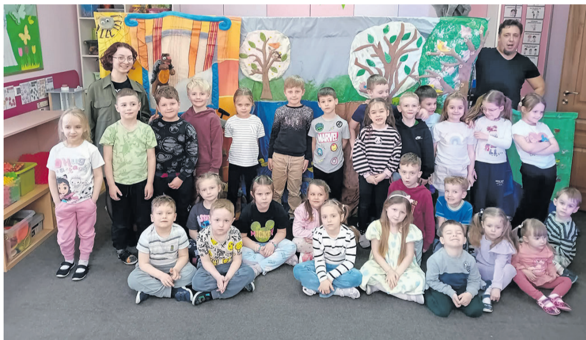
To ich drugi dom

TWARDOGÓRA • Przedszkole Sióstr Opatrności Bożej przeszło kontrolę prawidłowości pobrania i wykorzystania dotacji otrzymanej z gminy.