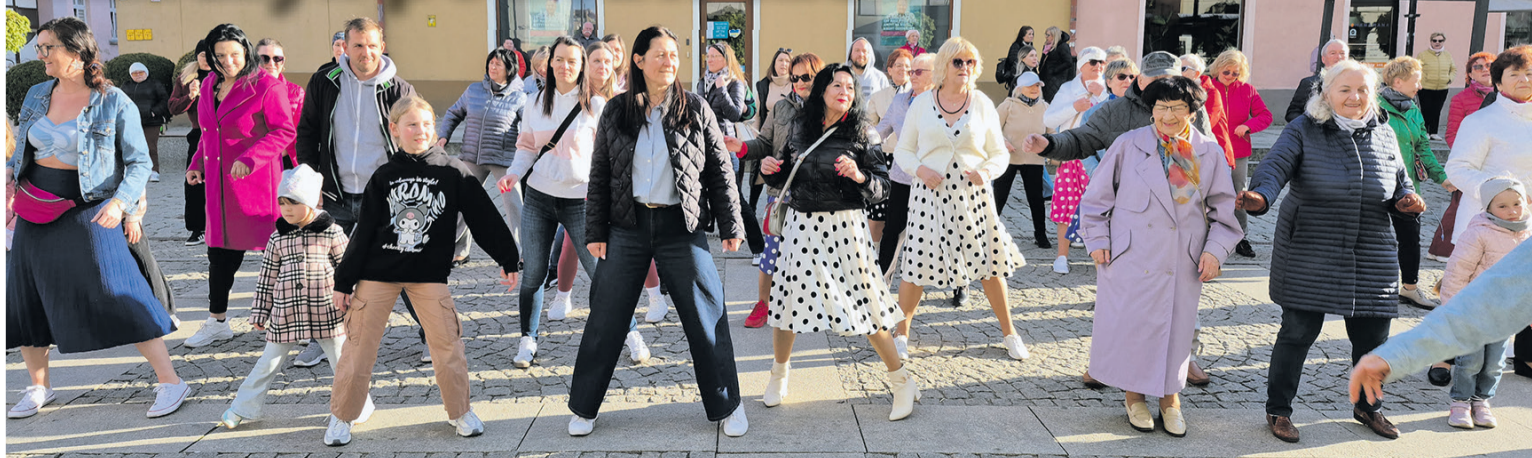
Mimo chłodu, ruszyli w tany