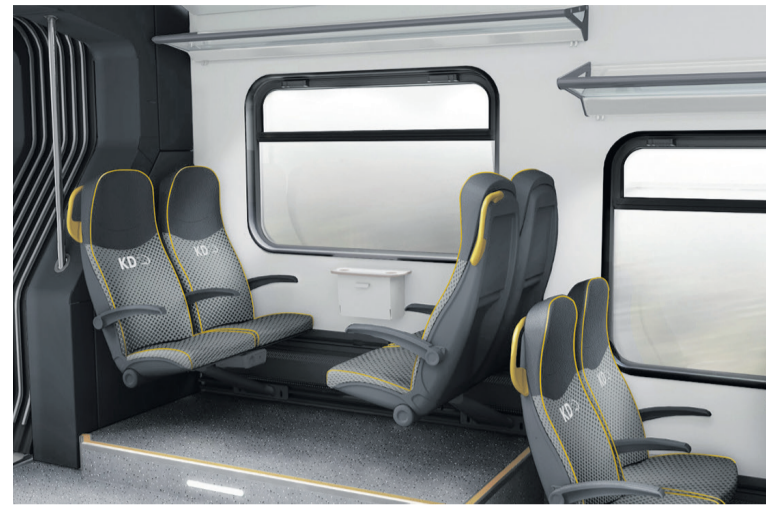
Czy pasażerowie zyskają?

Propozycja zakłada znaczące zagęszczenie siatki połączeń na trasie Ostrów Wielkopolski - Oleśnica - Wrocław. Koleje Dolnośląskie miałyby uruchamiać siedem par pociągów dziennie (obecnie Polregio oferuje sześć kursów). Na odcinku Ostrów - Oleśnica