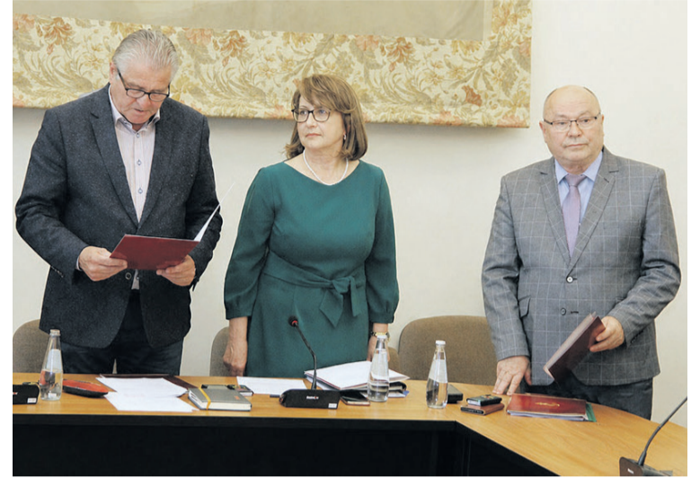
PiS ostro ocenia działania rządu