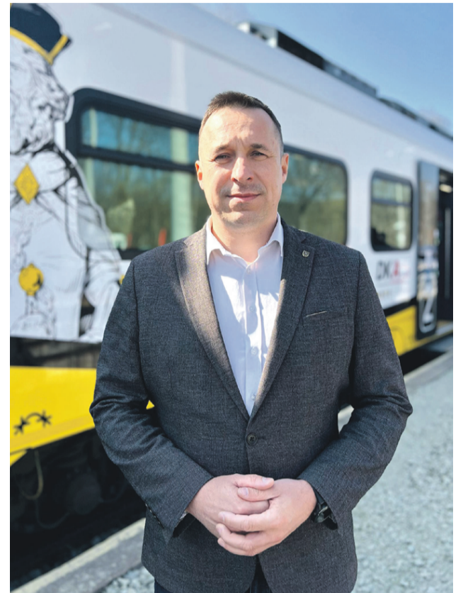
- Zależy nam na tym, aby jak najwięcej Dolnoślązaków wybierało kolej w codziennych przejazdach - marszałek Paweł Gancarz

Ponad 2,5 miliona pasażerów w jednym miesiącu, rosnąca flota i miliardowe inwestycje - Koleje Dolnośląskie osiągają najlepsze wyniki w swojej historii. Za sukcesem stoi konsekwentna polityka rozwoju i skuteczne wykorzystanie funduszy unijnych.