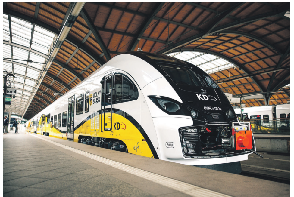
Koleje Dolnośląskie dysponują jedną z najnowocześniejszych flot w Polsce