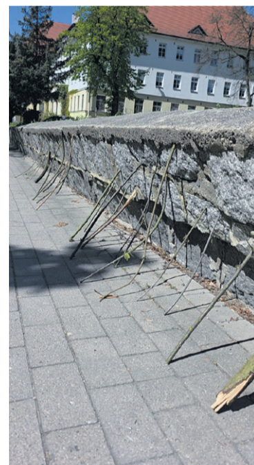
Czy to pomoże?