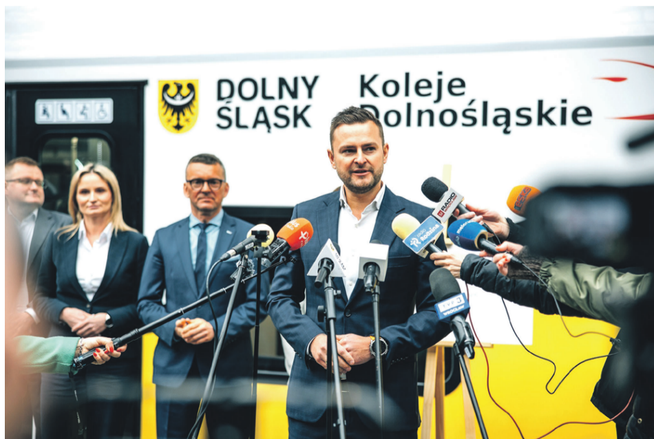
- Kolej na Dolnym Śląsku to dziś naturalny wybór - szybka, wygodna i dopasowana do codziennych potrzeb mieszkańców - Michał Rado, Wicemarszałek Województwa Dolnośląskiego