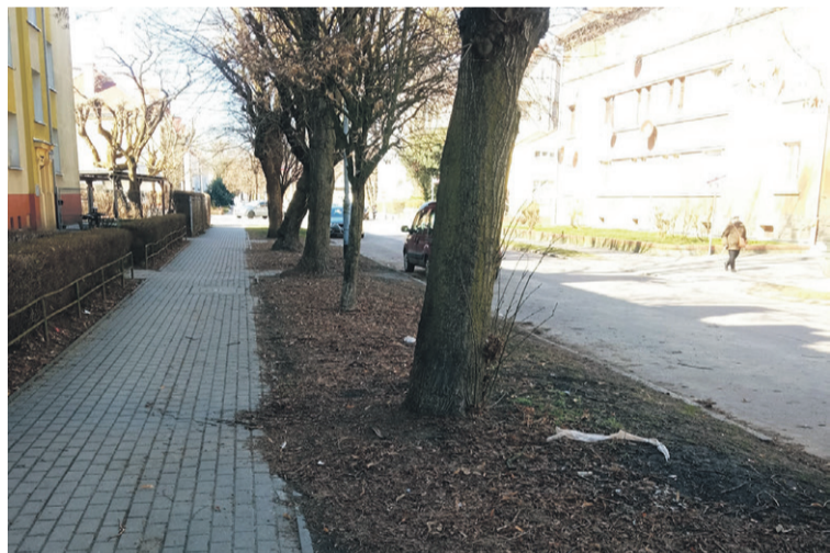
Wygląda na strefę niczyją...