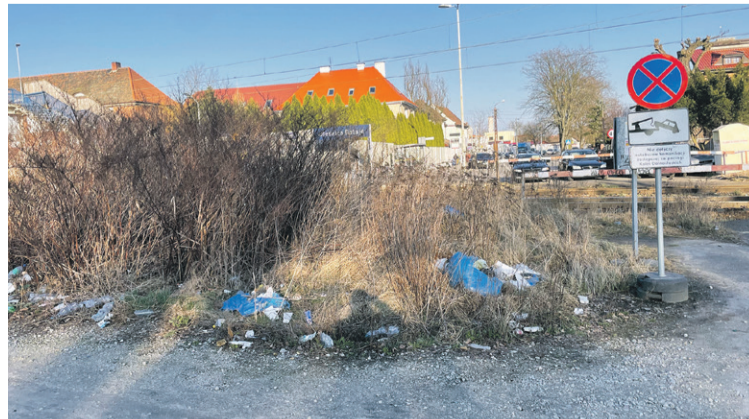
Czas zakasać rękawy...

I przesłał do redakcji obecny widok wysypiska i to, jak wyglądało jeszcze przed miesiącem. Widać, że góra śmieci rośnie w oczach. Czy to teren miasta, czy kolei? Nie wiemy