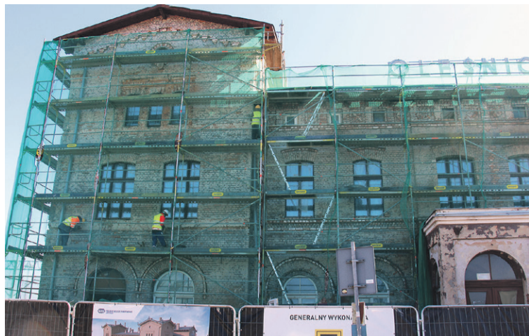
Ceglana elewacja to będzie hit