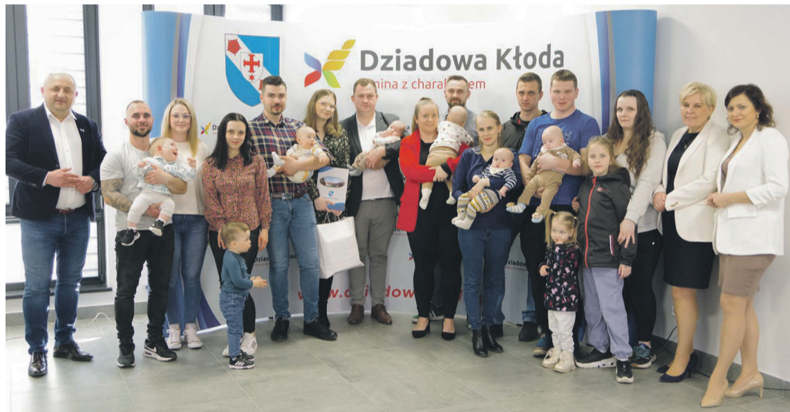
Witajcie w naszej (gminnej) bajce!