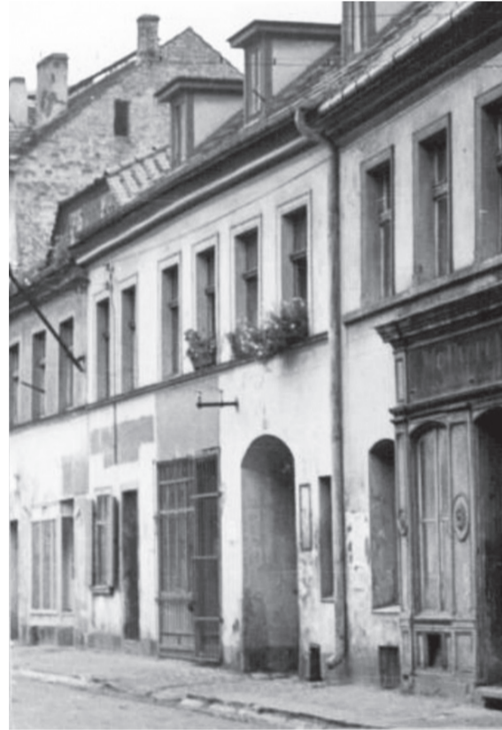
Znajdź wszystkie różnice...