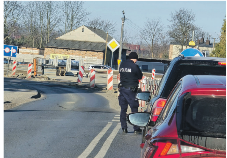
Pan chciał jechać na czerwonym?...

SYCÓW • To jest miejsce jest na co dzień krytyczne. Ale w czwartek nastąpiła zmiana.