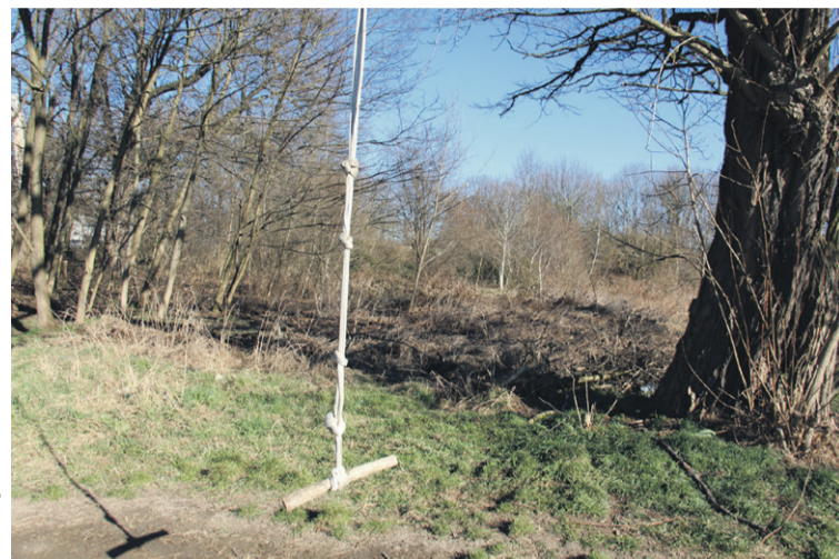
Prowizoryczna huśtawka na jednym z drzew