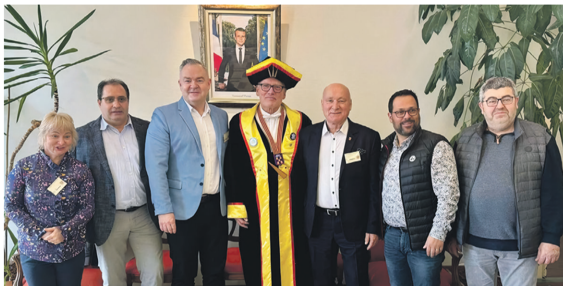
Z przyjacielską wizytą w partnerskim mieście

Delegacja miasta gościła w partnerskim Januay-Marigny.