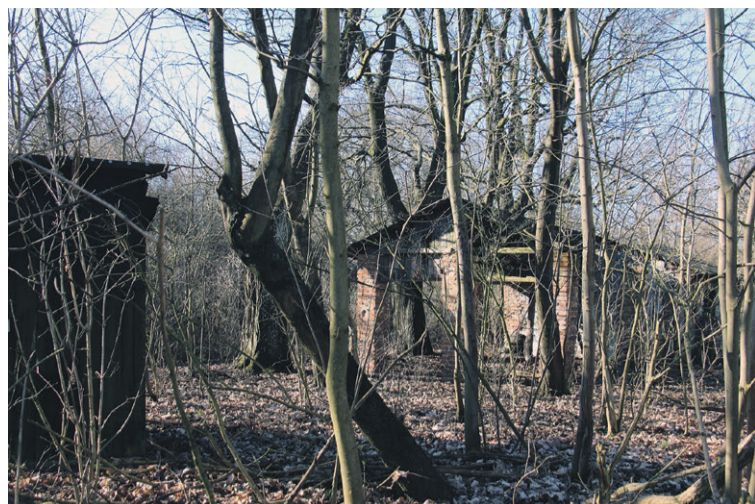
To jest prawdziwa dżungla