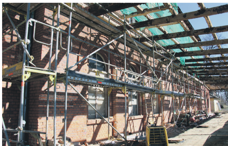
Jest sporo dłubania...