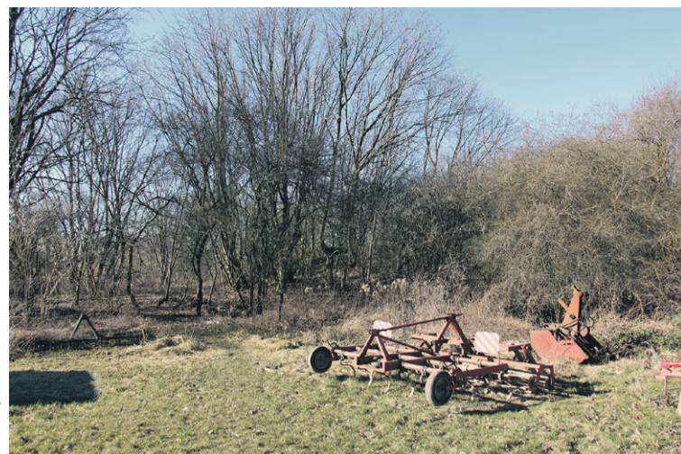
Na obrzeżach dawnego parku leżą w nieładzie maszyny rolnicze