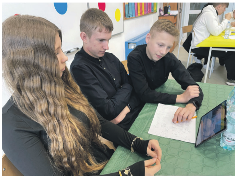
Co my tu mamy? Liczbę pi...