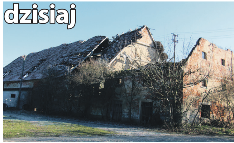
Musi samo się zawalić...

Okazało się, że przed wojną w tym miejscu był niemiecki dwór, spalony w 1945 roku przez Sowietów. Do domostw, które tu pozostały, przyjechali repatrianci ze wschodu, głównie z Siemianówki. I to oni i ich rodziny gospodarzyli na pozostawionym majątku, uprawiając okoliczne pola.