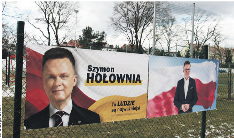
Ten baner zniszczony nie został

„U mnie w mieście przecznice ode mnie wisi od niedawna plakat Hołowni. Już jakieś debile pomazały i napisali farbą/sprejem „śmieć”. My nie dojrzelismy do demokracji ewidentnie. Nigdy nie zrozumie takich praktyk. W ogóle mamy wpisane chyba w polskość takie „kurde... muszę wyrazić swoją opinię na czyjejs