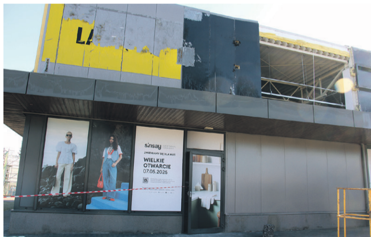
Przygotowanie nowego sklepu trwa

W nowej lokalizacji sklep zostanie otwarty 7 maja.