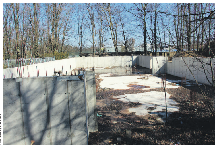
Pojawiły się jakieś problemy...

Decyzję o warunkach zabudowy dla działki wydał burmistrz w marcu 2022 roku. Deweloper dostał wydane z kolei przez starostę pozwolenie na budowę budynku wielorodzinnego o pow. zabu-