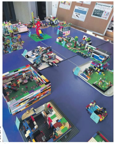
Oj, było co oglądać w czasie przerw...

24 marca w konkursie będą uczestniczyć uczniowie z klas 4-8. (OAI)