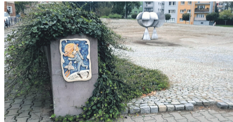
Ktoś ma jakiś nowy pomysł?