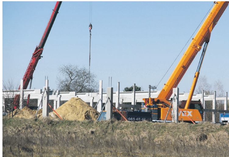
Dwa żurawie układają gotowe elementy