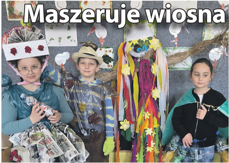
Sesja zdjęciowa przed wyjściem na miasto

Dwie klasy Szkoły Podstawowej nr 3 w Oleśnicy połączyły powitanie wiosny z ekologią.