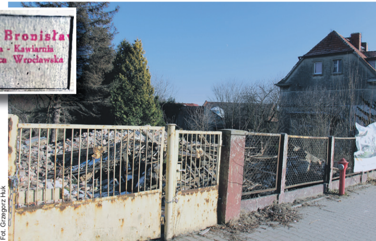
Tego domu już nie ma

„Ich dom (i restauracja) stał niedaleko domu, który zajmował pluton łączności Armii Czerwonej (obecnie nr 32), co powodowało, że nie było napaści ze strony różnych bandytów, ale jednocześnie narażało ich na nocne najścia ze strony uzbrojonych pijanych żołnierzy ACz, którzy żądali wódki. Nie można było im odmówić, bo byli nieobliczalni. Później byli bardziej zdyscyplinowani i nie chodzili z bronią. Z tym sąsiedztwem męczy-