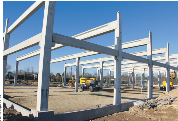
Jeszcze tylko dach...