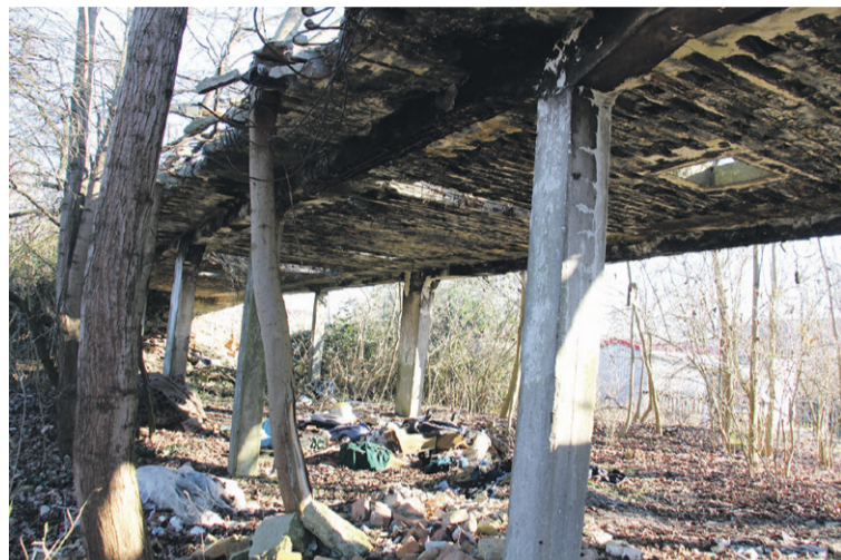
Rozsypują się resztki zabudowy