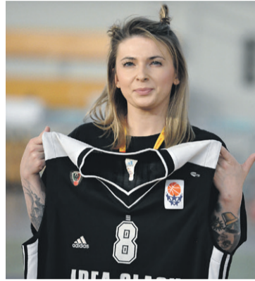
Licytacja była na plus