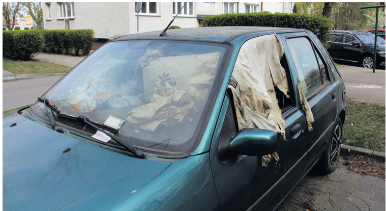
Zmieniają się w koczowiska