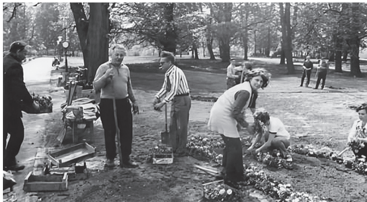
Sadzenie kwiatów na klombie w parku obok Parkowej