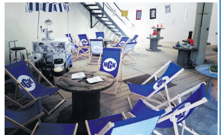
W tym miejscu można się zrelaksować, a nawet... zjeść kolację w walentynki

ulicy Brzozowej. Jest połączona z całym systemem wodociągowym miasta, a głównymi nitkami zasilającymi są magistrale wodociągowe z dwóch stacji uzdatniania wody: przy ulicy Brzozowej i Dobroszyckiej.