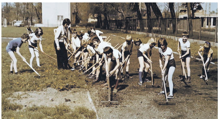
Praca w ramach Dni Kultury i Sportu, rok 1979. Młodzież sprząta teren boiska SP2. Dzisiaj stoi tu hala MOSIR. W oddali widać budowę Żłobek