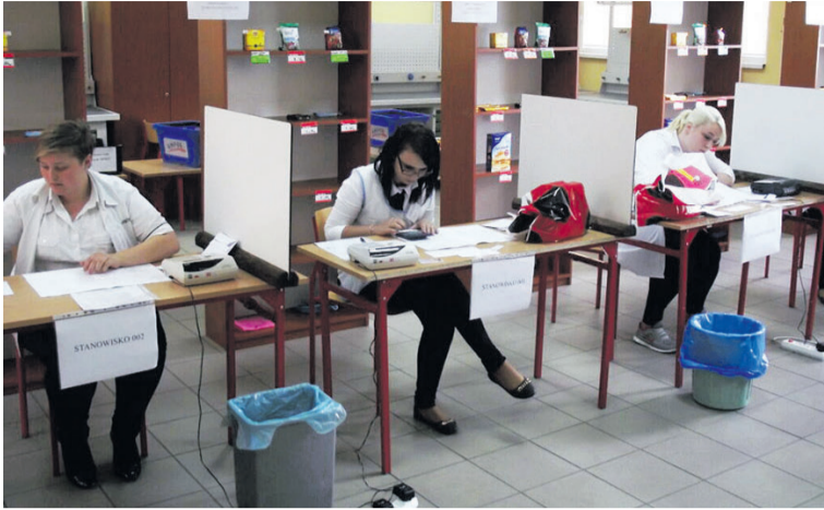
W Centrum uczą się zawodów