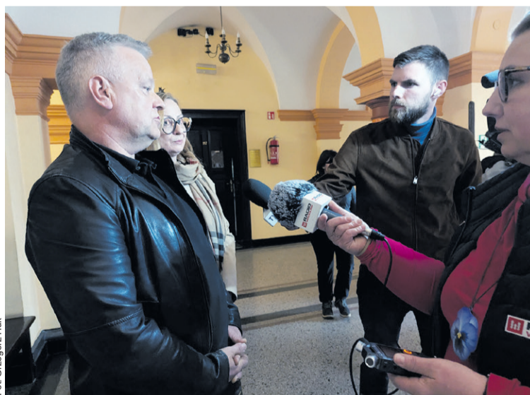
Ojciec pokrzywdzonej mówił o traumie córki