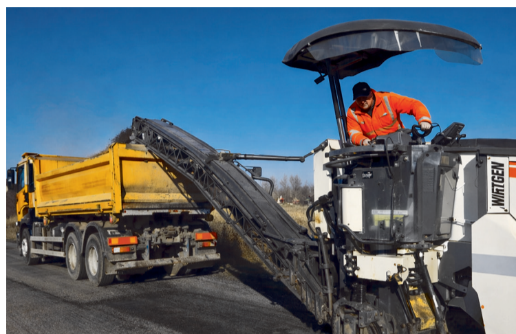
Naprawy dróg ruszyły pełną parą