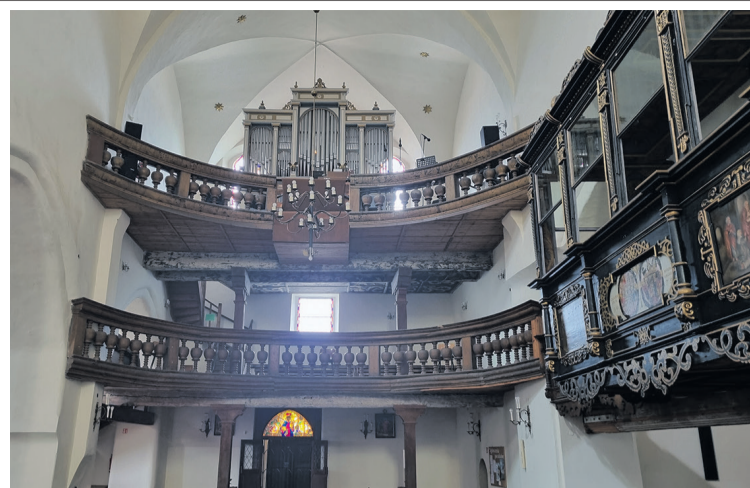
Wydarzenie w kościele było inauguracją obchodów 760-lecia Bierutowa

W Bierutowie odbyła się premiera wyjątkowej publikacji, opowieści lektorskiej „Kościoł pw. Katarzyny Aleksandryjskiej - Kamienna Kronika Bierutowa”. Wydarzenie w