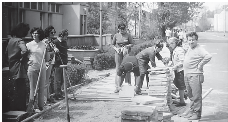
Wymiana płytek przed bibliotekami - publiczną i pedagogiczną