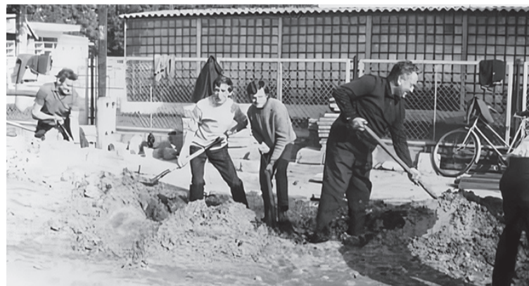
Nauczyciele pracują na ulicy Kaliskiej przed Targowiskiem