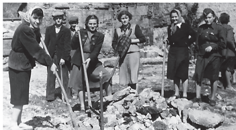
Pierwzór czynu społecznego - sprzątanie gruzów po zamku, koniec lat 50.

SYCÓW • Praca, niekoniecznie chętnie wykonywana, czyli Święto Pracy.