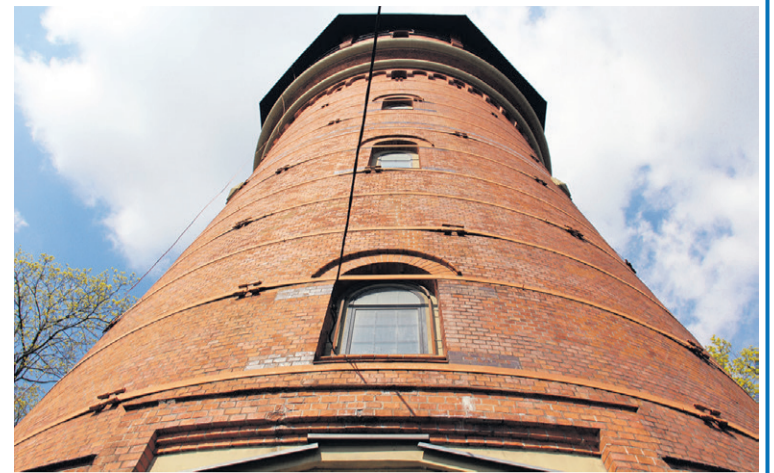
To obiekt nieodłącznie kojarzący się z Oleśnicą

Rzeczywiście, wieża ciśnień została wybudowana w tym samym czasie co stara stacja przy