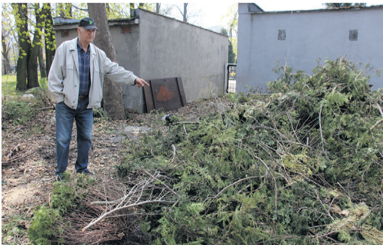
Ktoś wyrzuca tu odpady zielone