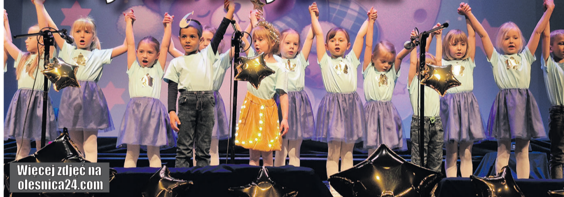
Wiecej zdjęć na olesnica24.com