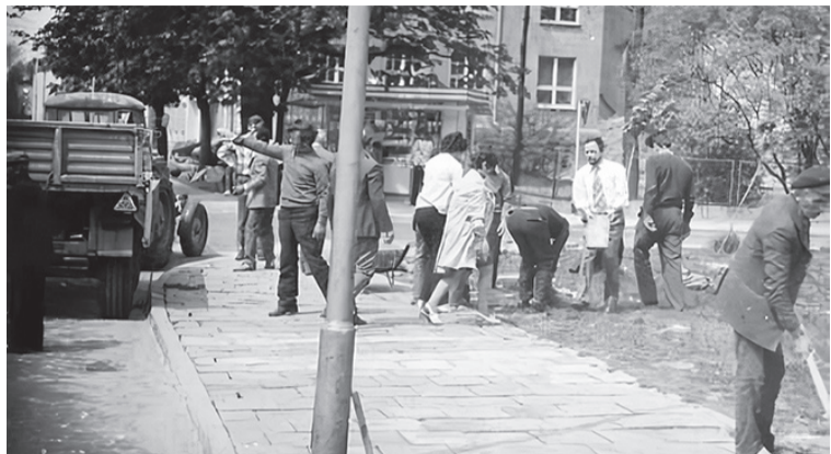
Naprawa chodnika przy ul. Kościelnej