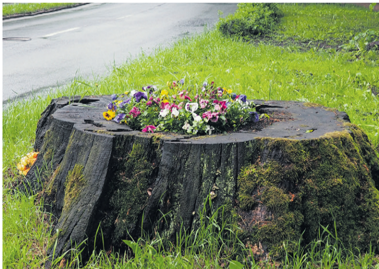
Pień dostał drugie życie

Kreatywność firmy od zieleni miejskiej godna pochwały.