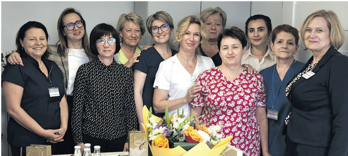
Dyrektor i załoga robią, co mogą, aby szpital działał jak najlepiej

Narodowy Fundusz Zdrowia zalega szpitalowi z zapłatą za kluczowe świadczenia ratujące życie i zdrowie pacjentów.