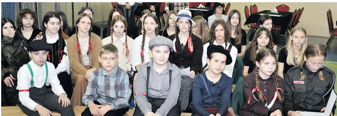
Pamiętaliśmy o obchodach 81. rocznicy przybycia pierwszych osadników na Ziemię Zachodnie

pełnosprawnych w ramach programu „Wyrównywanie różnic między regionami III”.