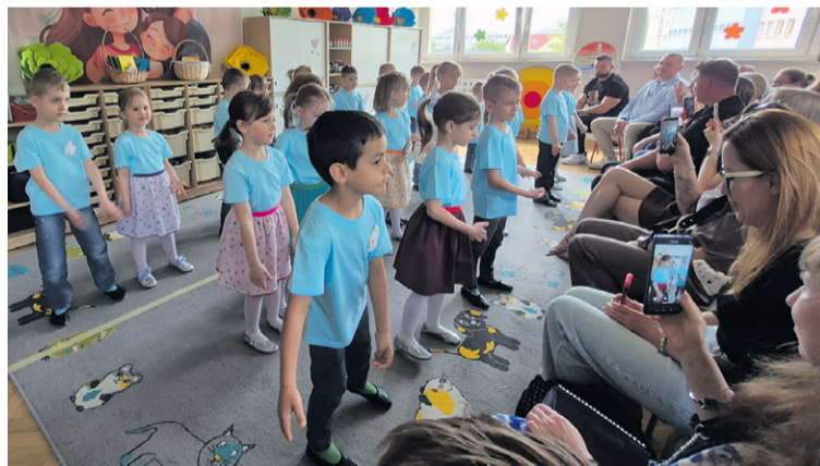
Program wypadł świetnie

Tak świętowały „Zuchy” w Przedszkolu nr 3 Dzień Mamy i Dzień Taty.