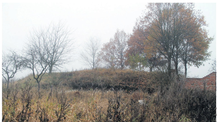
Tu znajdowało się grodzisko

LIPKA • Mało kto wie o tym miejscu w gminie Dziadowa Kłoda.