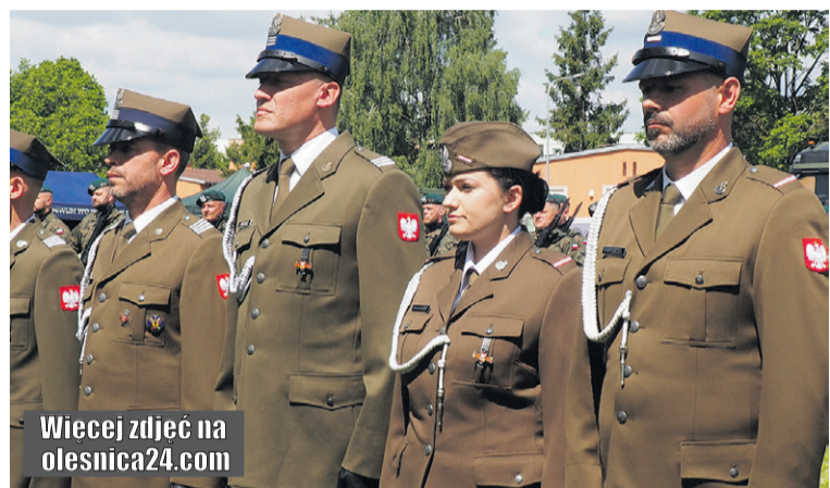
Wiecej zdjęć na olesnica24.com