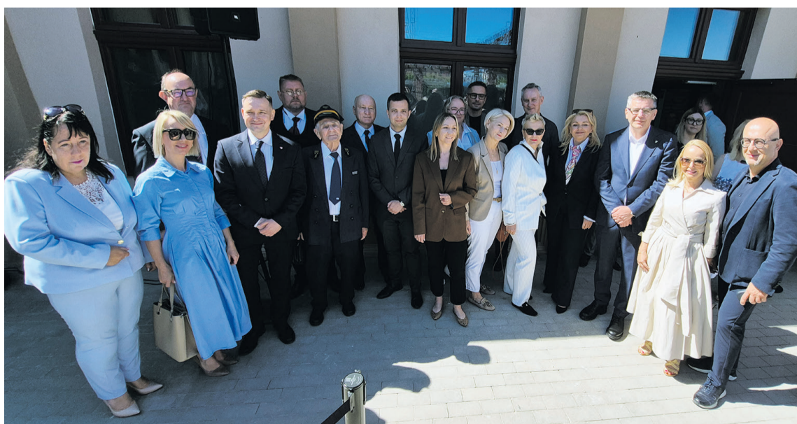
Ta fotografia będzie dla każdego z uczestników otwarcia dworca historyczną pamiątką