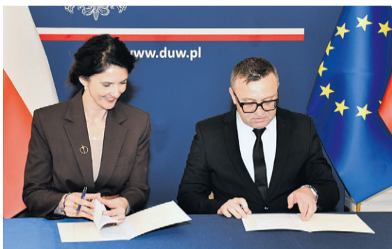
Z wojewodą podpisano umowę na dofinansowanie przebudowy drogi gminnej w Świerznej

Przypomnijmy, że umowę na dofinansowanie przedsięwzięcia podpisano 18 września 2025 roku pomiędzy Powiatem Oleśnickim a Gminą Oleśnica. Projekt jest współfinansowany ze środków Państwowego Funduszu Rehabilitacji Osób Nie-