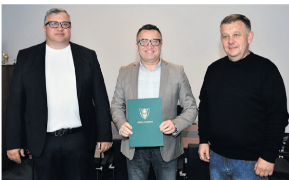
Przebudowę ulicy Świerkowej w Spalicach wykona Tom Trans Tomasz Walczak za 2,325 mln zł