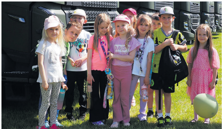
Dla nich to było duże przeżycie