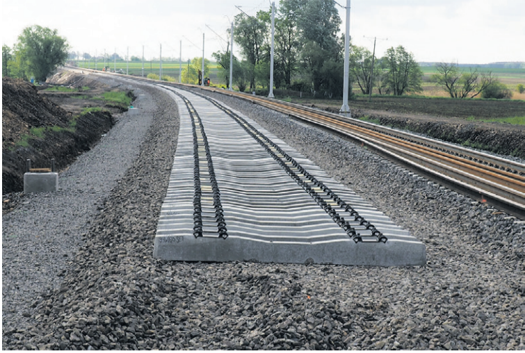
To jeszcze nie koniec robót