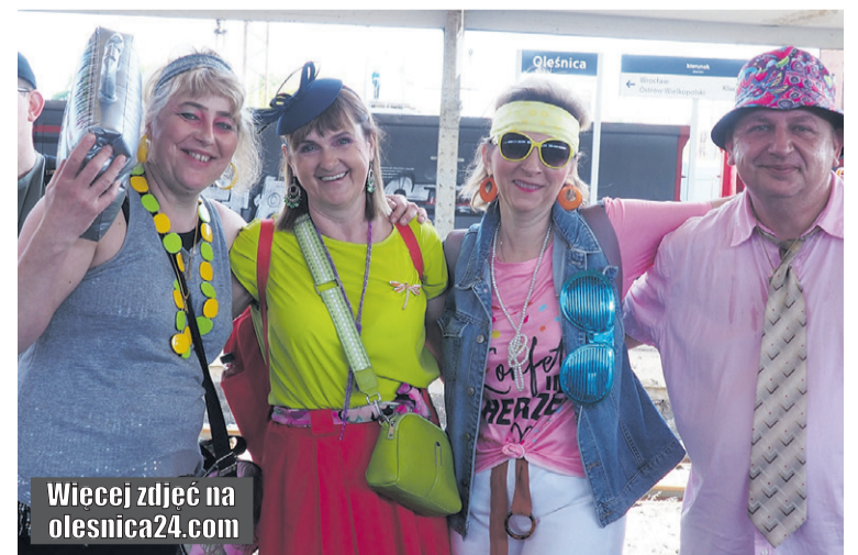
Pojechali w siną dal...

W niedzielny poranek na trzecim peronie zgromadziła się wyjątkowo liczna grupa pasjonatów historii kolei. Nie zabrakło charakterystycznych przedwojennych strojów, współczesnych, często humorystycznych uniformów oraz atmosfery dobrej zabawy i wspólnego świętowania.