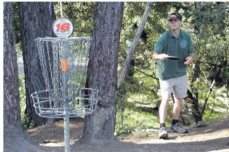
Zagramy w to w Oleśnicy

Na czym polega disc golf? To dyscyplina sportowa polegająca na rzucaniu specjalnym dyskiem w kierunku celu, w jak najmniejszej liczbie prób. Zasady są zbliżone do klasycznego golfa, ale zamiast piłki i kija używa się jednak latającego dysku. Rozgrywka odbywa się na polu składającym się zwykle z 9 lub 18 „dołków”, czyli stanowisk docelowych. Gracze rozpoczynają rzut z wyznaczonej