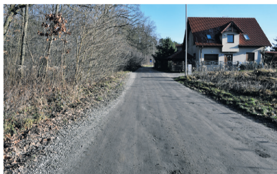
Obecnie Świerkowa nie spełnia podstawowych standardów - brakuje m.in. odwodnienia i oświetlenia

Wykonawcą zadania została firma Tom Trans Tomasz Walczak, która złożyła najkorzystniejszą ofertę w przetargu. Wartość kontraktu wynosi ponad 2 mln 325 tys. złotych.