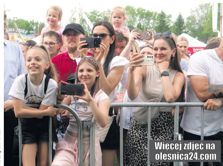
Nagranie będzie pamiątką tych niezapomnianych chwil

Audyt ma sprawdzić zgodność obu instytucji z dwoma kluczowymi regulacjami: Rozporządzeniem Rady Ministrów w sprawie Krajowych Ram Interoperacyjności (KRI) oraz Ustawą o Krajowym Systemie Cyberbezpieczeństwa (UKSC). Wynikiem audytu ma być szczegółowy raport zawierający: