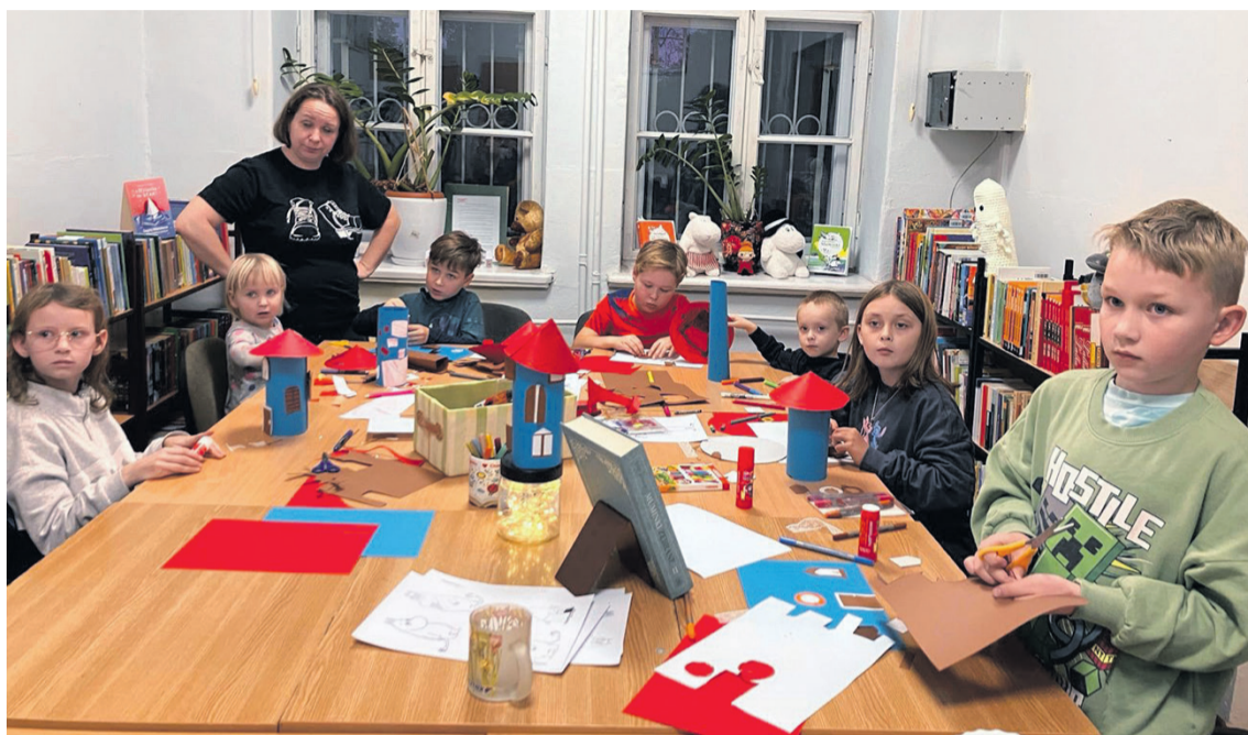
Biblioteka stała się miejscem warsztatów

Bibliotekę odwiedziły 4404 osoby, zarejestrowano 389 aktywnych czytelników, co oznacza wzrost o około 35% w stosunku do roku poprzedniego.