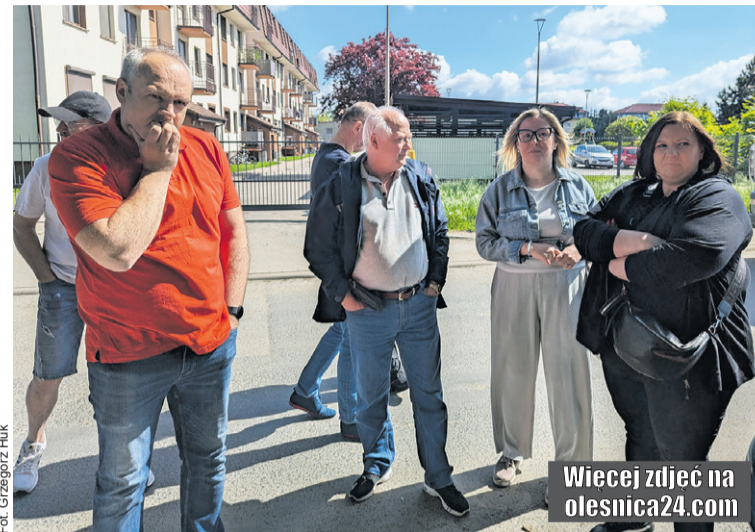
Wiecej zdjęć na olesnica24.com

Podobne wątpliwości zgłaszali przedsiębiorcy prowadzący dzia-