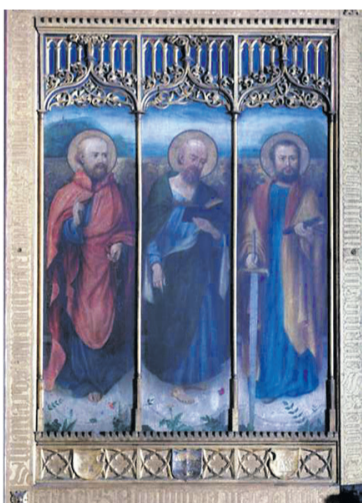
Napisy zostały odczytane

W wolnym tłumaczeniu brzmi: „Święta Mario, [patronko] Bractwa Różańcowego, święty Michale, [pa-