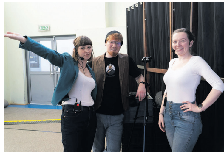
Zapraszają do bierutowskiej biblioteki

pracowników biblioteka wyraźnie otworzyła się na mieszkańców, poszerzając swoją ofertę i budując wokół siebie coraz liczniejsze grono odbiorców.