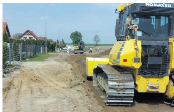
W Bystrem prowadzone są intensywne prace związane z przebudową ulicy Mokrej

W Urzędzie Gminy podpisano umowę na przebudowę drogi wewnętrznej - ulicy Świerkowej w Spalicach. Inwestycja znacząco poprawi komfort i bezpieczeństwo mieszkańców dynamicznie rozwijającej się części gminy.