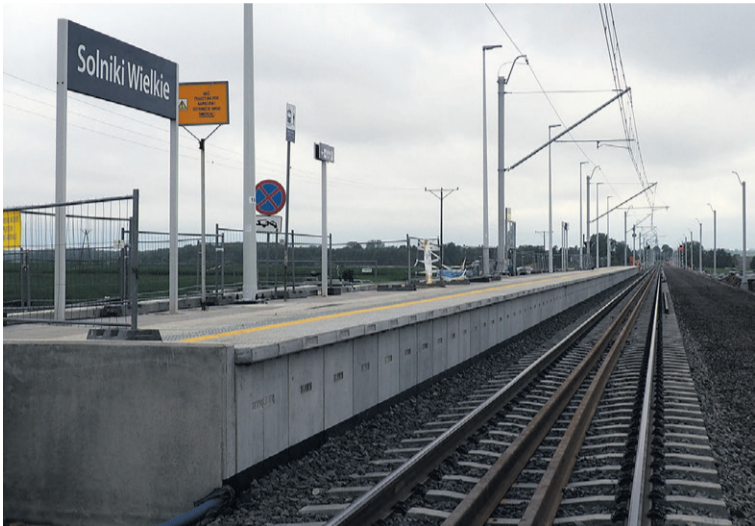
Kiedyś budowano dworce, a dziś...