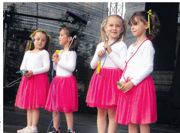
...a nawet jeszcze młodszych!