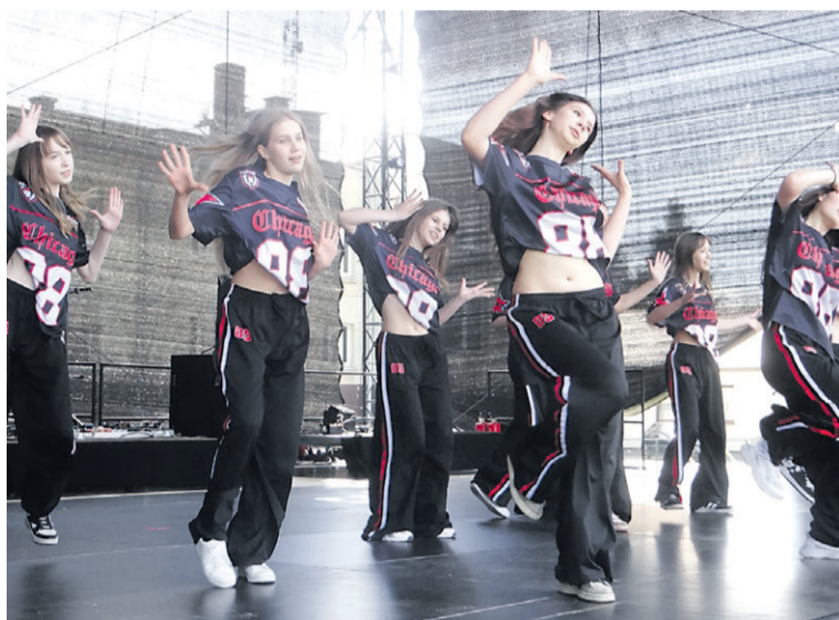
Syców to miasto młodych...