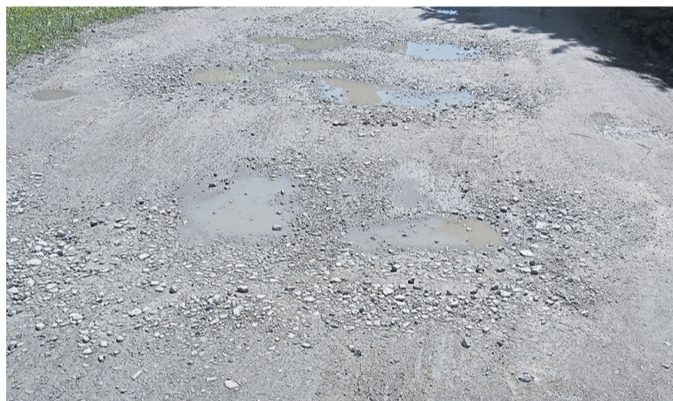
Po deszczu wygląda tak

Miasto odpowiada w sprawie ulic Ślusarskiego i Malinowskiego. Nadal bez terminów realizacji.