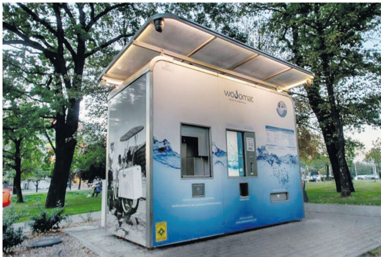
Taki wodomat stoi w Rybniku

„To ekologiczne i praktyczne rozwiązanie” - sugeruje radny.