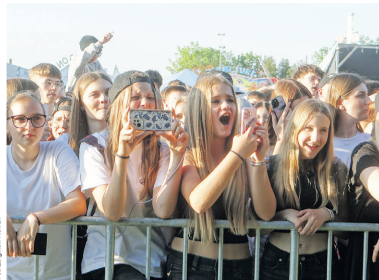
O rany, to naprawdę on?!