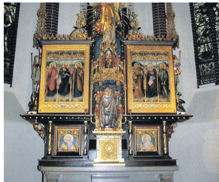
Tak wyglądają skrzydła ołtarza

kościół filialnego w Kozie Wielkiej, święty Marku, [patronie] kościoła sepulkralnego w Komorowie (dziś Święty Marek), św. Franciszku, [patronie] trzeciego zakonu świeckie-