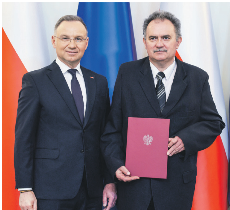
Sesja fotograficzna z prezydentem

Oceną zanieczyszczenia gleb i osadów, czynnikami kształtującymi rozpuszczalność metali i metaloidów oraz ich pobieranie z gleb zanieczyszczonych; rekultywacją terenów zdegradowanych przez górnictwo i przemysł w tym z wykorzystaniem przetworzonych odpadów; kształtowaniem właściwości fizykochemicznych i żyzności gleb w warunkach użytkowania rolniczego, genetyką, właściwościami, klasyfikacją i kartografią gleb; a także wpływem jednogatunkowych drzewostanów świerkowych na właściwości gleb górskich i spodziewane efekty przebudowy składu drzewostanu na przykładzie Gór Stołowych.