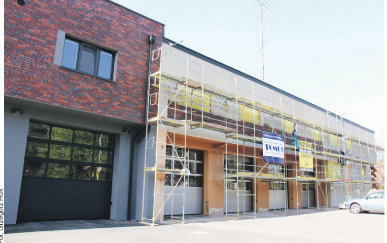
Nowoczesność wkracza do remizy strażaków