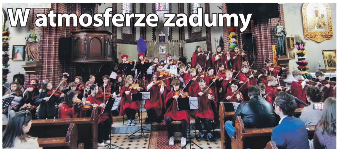
Zagrali utwory od Bacha po Kowalskiego