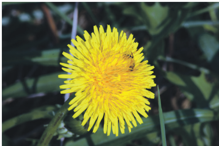
Fotografia przyrodnicza to od lat pasja leśniczego Marka Mielczarka