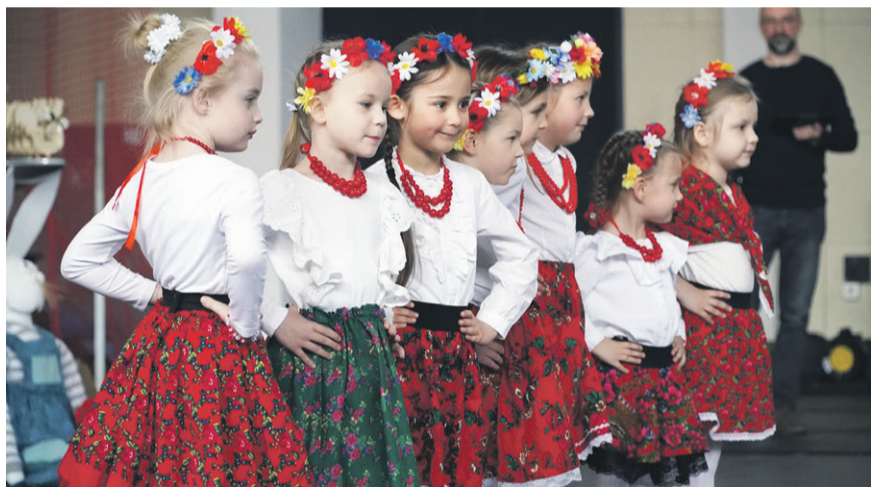
„Kogutek” łączy pokolenia