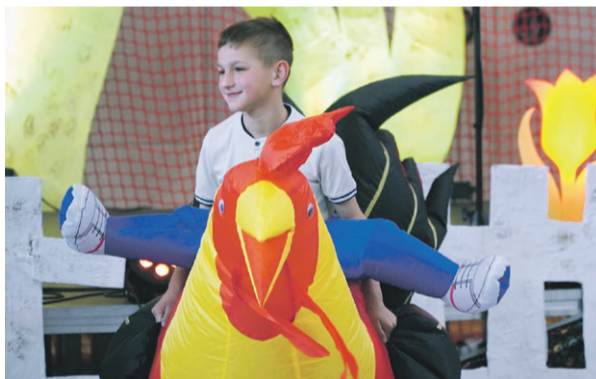
Na „Kogutku” nie zabrakło kogutków...