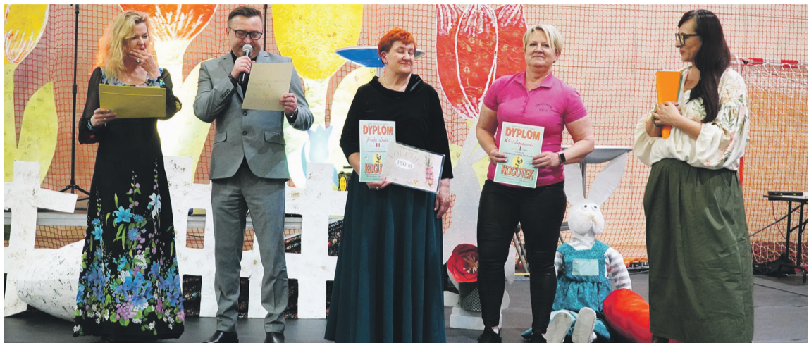
Twórcy najpiękniejszej palmy otrzymali nagrody