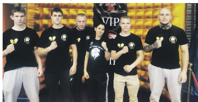
Jest się czym pochwalić