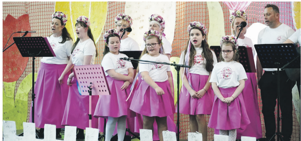
Występ zespołu „Skokowianki” ze Skokowej