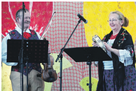
Zespół „Zazula” z Poniatowic