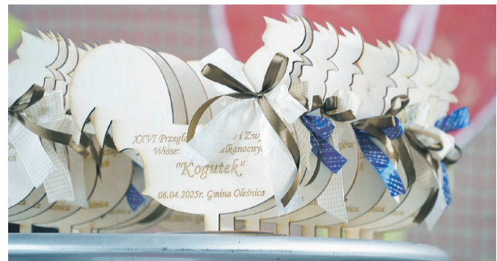
...również tych pamiątkowych