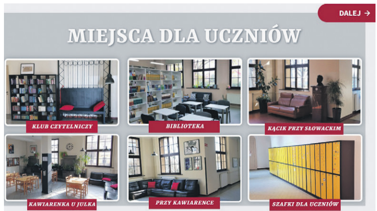
Kadr z ulotki interaktywnej.