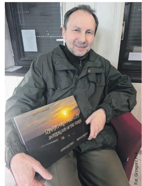
Fotograf i jego album