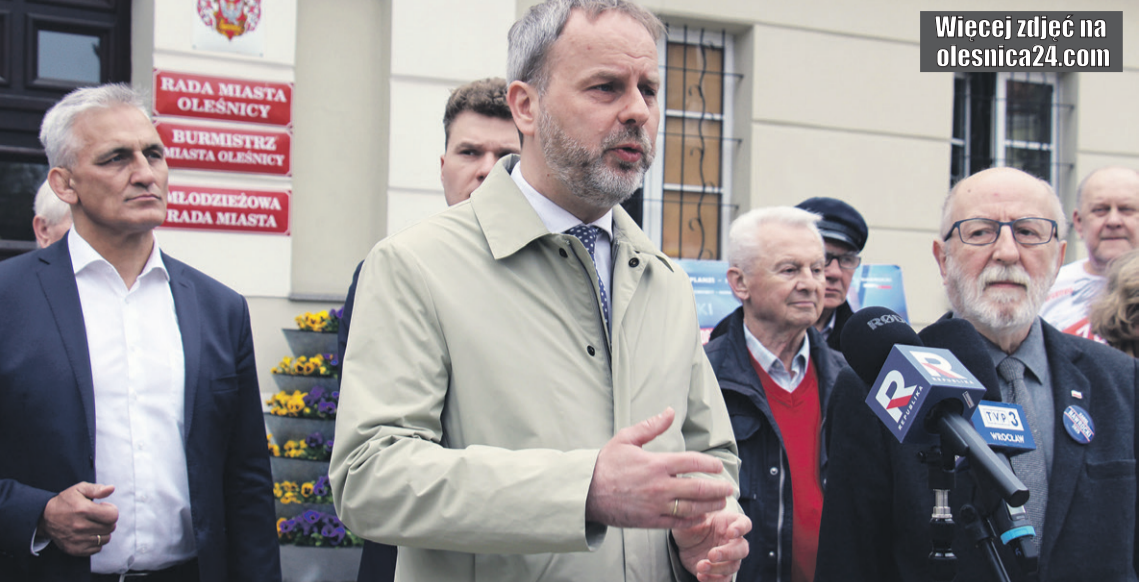
Posłom towarzyszyli działacze PiS z Oleśnicy

Gdy przejmowaliśmy władzę w roku 2015, wolna kwota od podatku wynosiła 3 tysiące złotych. Kiedy tę władzę oddawaliśmy, kwota wolna od podatku wynosiła już dziesięciokrotnie więcej, 30 tysięcy złotych. I to wszystko udało się zrobić przy dużo mniejszym deficycie państwa niż po roku rządów Platformy Obywatelskiej. Przypomnę, że kiedy oddawaliśmy władzę, deficyt państwa wynosił 80 miliardów złotych. Po roku rządów Platformy wynosi już 240 miliardów złotych. A więc obniżaliśmy podatki, a jednocześnie, jeżeli chodzi o kwestię deficytu czy też długu w