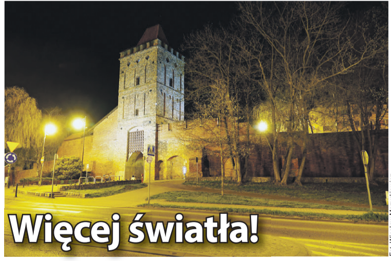
Dach Bramy pogrążony jest w ciemności