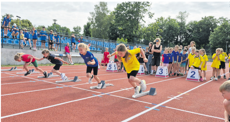
Dobry start połowa sukcesu

W Oleśnicy odbyły się ostatnie przed wakacjami zawody lekkoatletyczne w strefie wrocławskiej.