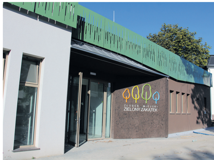
Jest 59 zgłoszeń na 52 miejsca

Budżet żłobka na 2025 rok wyniósł ponad 1,125 mln zł. Placów-