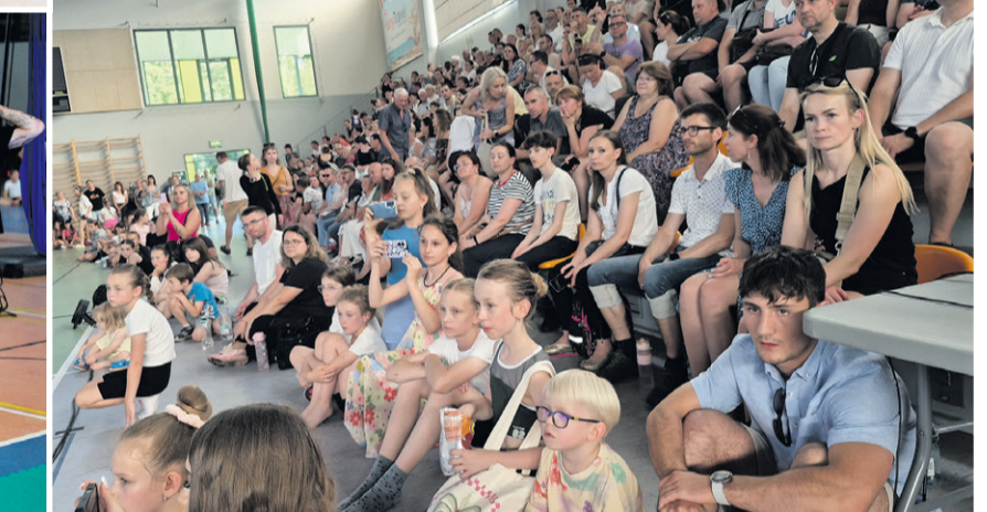
(kad) Mnóstwo występujących, komplet widzów, gorące emocje...