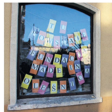
Nigdy nie powstała