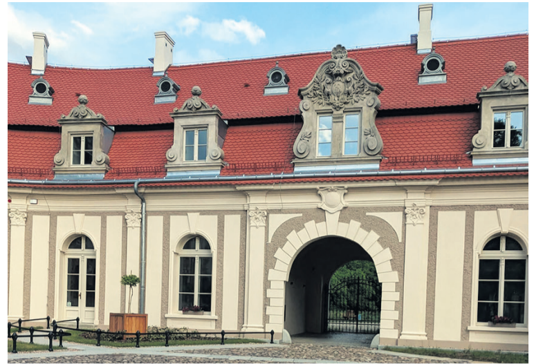
Przypałacowy budynek przyciąga wzrok

Efekty prac restauratorskich są wyraźnie widoczne. Odnowiona elewacja, detale architektoniczne i majestatyczna bryła budynku pozwalają zobaczyć nie tylko w części dawny blask rezydencji, ale także ogromny potencjał, jaki drzemie w tym miejscu. Jak podkreśla Ewa