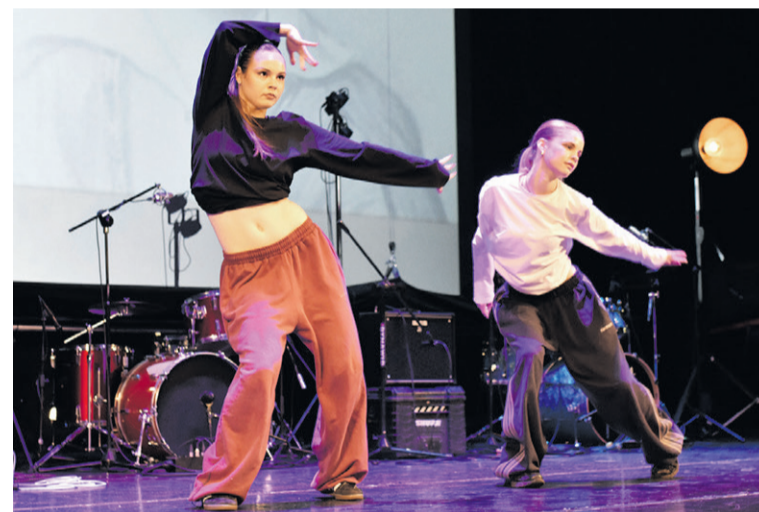
Talentów w szkole nie brakuje