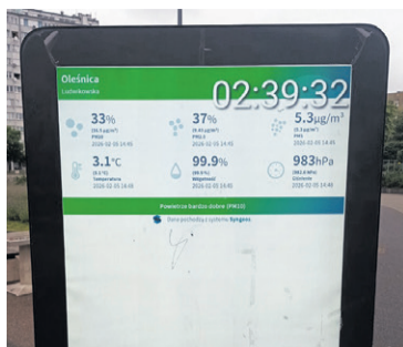
Czas się zatrzymał

Trudno więc mówić o funkcji informacyjnej, skoro mieszkańcy zamiast bieżących informacji otrzymują komunikaty sprzed wielu miesięcy. Totem miał być nowoczesnym elementem miejskiej infrastruktury, dostarczającym aktualnych informacji o mieście. Dziś