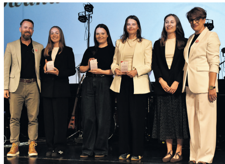
Zapracowały na ten sukces