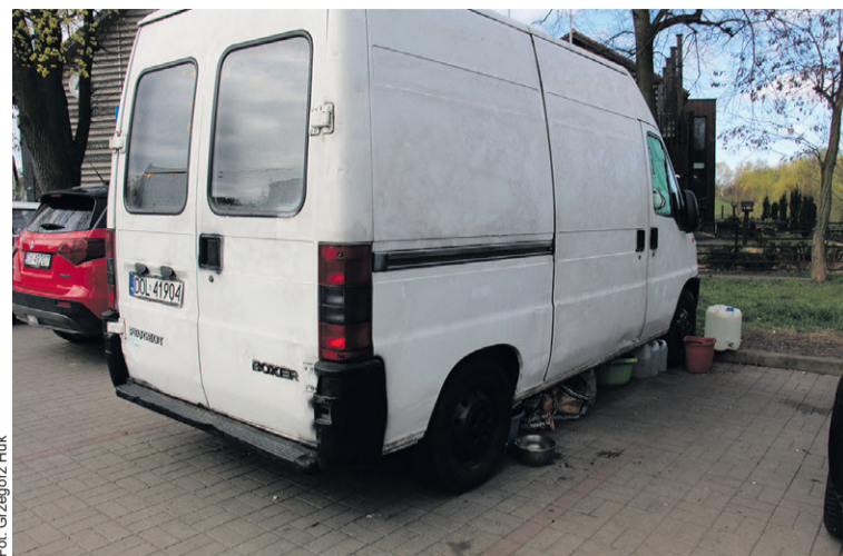
Pies z busa pogryzł kobietę w parku

Zdaniem radnego z klubu Oleśnica Dla Was późniejsze wyda-