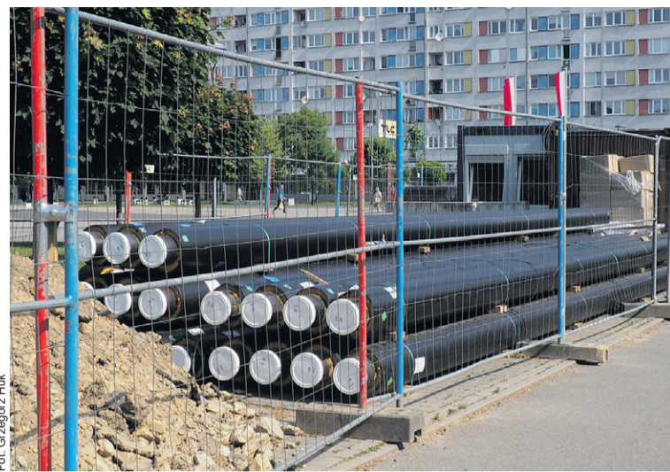
Takie mamy teraz widoki

Jednym z prowadzonych zadań jest wymiana sieci ciepłowniczej w rejonie ulic Lwowskiej i Skłodowskiej. Stara sieć kanałowa o średnicach DN 250 i DN 200 zostanie zastąpiona nowoczesnymi rurami preizolowanymi. Łączna długość modernizowanego odcinka wynosi 388 metrów. Wykonawcą