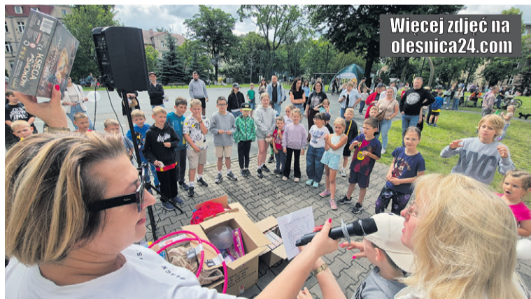
Pani dyrektor rozdaje nagrody

Kończący rok szkolny festyn integruje uczniów, rodziców i nauczycieli.