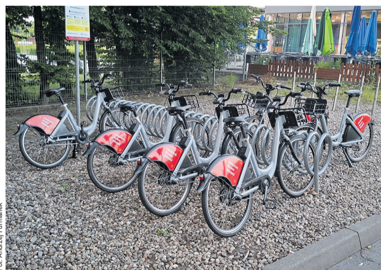
Rowery nie spełniają wymagań

Przypomnijmy historię tej zmiany operatora. 30 stycznia 2026 roku miasto otworzyło oferty w przetargu na wieloletnią obsługę systemu rowerów miejskich. Rekola Bikesharing (konsorcjum polsko-czeskie) zaoferowała najniższą cenę - 36.565 zł brutto miesięcznie,