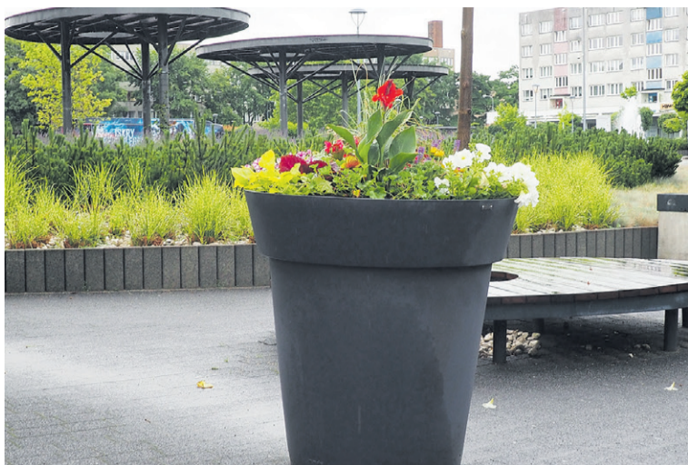
Donice ustawiono na centralnym placu miasta