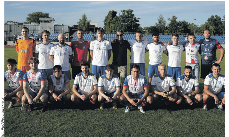
Niestety awansu nie będzie

Worek z bramkami rozwiązał się dopiero w 69. minucie. Po dalekim wrzucie z autu i zamieszaniu w polu karnym, Świerczyński uderzył głową z najbliższej odległości pod poprzeczkę,