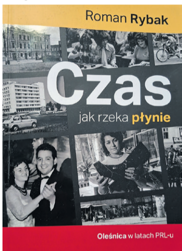
Książka jest do kupienia w bibliotece na Reja za jedyne 35 zł