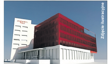
widok od strony ronda