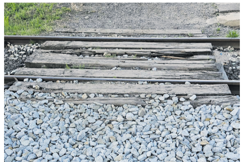
I jak tu przejechać z wózkiem...

Władze miasta oraz przedstawiciele kolei z dumą prezentują wyremontowany dworzec. Trzeba przyznać, że obiekt po modernizacji wygląda estetycznie i nowoczesnie. Ale w tej beczce miodu są też ciężkie dziecięci.