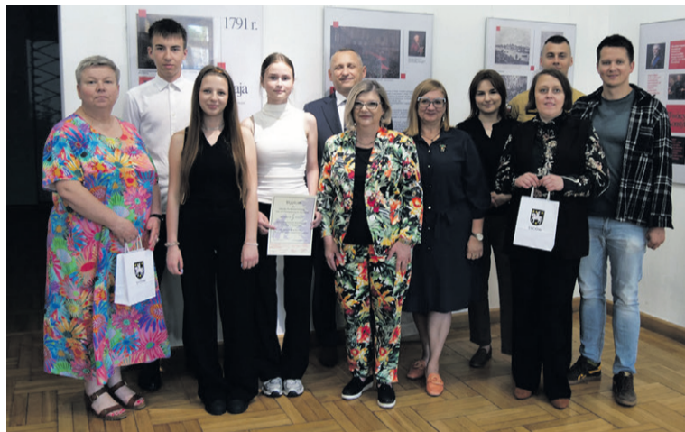
Drużyna SP1 Syców z opiekunką i jurorzy konkursu

SYCÓW • Duże emocje podczas XXII Konkursu Wiedzy o Regionie.