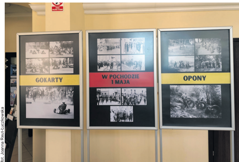
Wystawa przenosi oglądających w lata 70. XX wieku

Kuczymański specjalizuje się w fotografii dokumentalnej i repor-