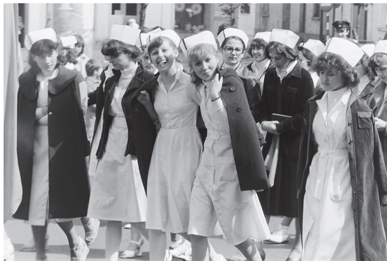
Najładniejsze dziewczyny w pochodzie pierwszomajowym