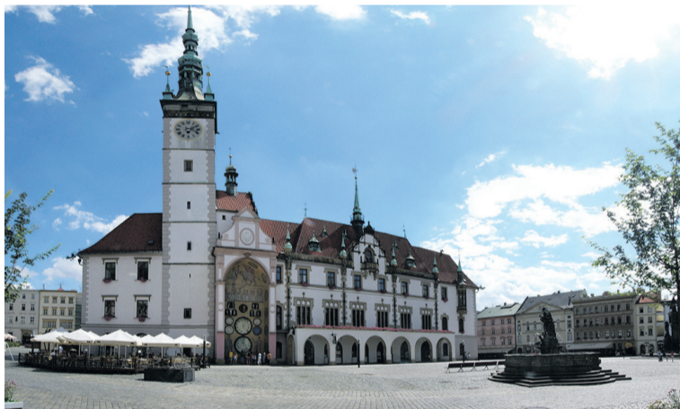
Ratusz w Ołomuńcu. Widać wnętrze na zegar astronomiczny