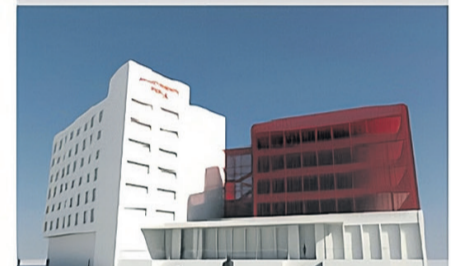
widok od strony ul. Śniapska