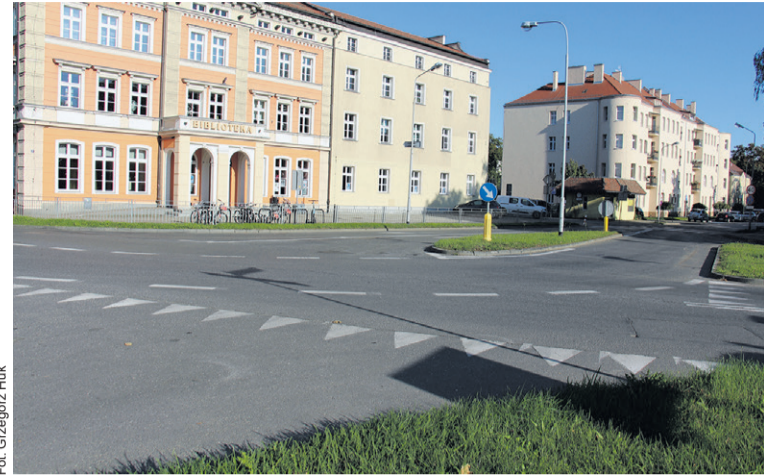
Na rondo w tym miejscu czekano od lat

Ma tu powstać nowoczesne rondo, które ma całkowicie upłynnić ruch w tym neuralgicznym punkcie miasta. Będą też nowe drogi rowerowe lub nowoczesna infrastruktura dla cyklistów, która płynnie połączy się z istniejącymi już ścieżkami