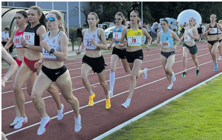
Święto LA w Oleśnicy