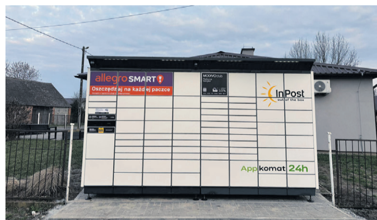
Kolejny paczkomat stanął w Świerzniej

Gmina zapowiada kontynuację inwestycji. W przygotowaniu są