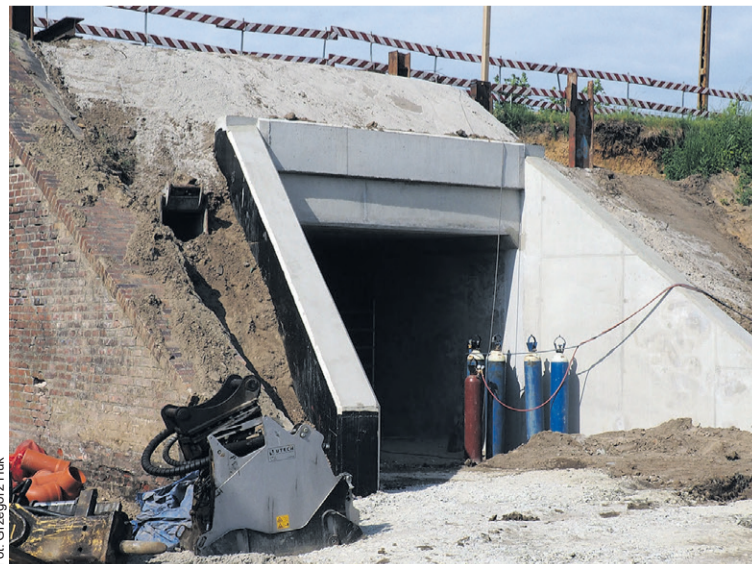
Od poniedziałku przejście miało być otwarte

To właśnie głębokie wykopki w rejonie dotychczasowego, tymczasowego, przejścia pod wiaduktem zaczęły stwarzać realne zagrożenie dla zdrowia i życia mieszkańców. Aby zapewnić stuprocentowe bezpieczeństwo osobom poruszającym się w tej okolicy, inwestor podjął kluczową decyzję: ruch rowerowy i pieszych zostanie czasowo przekierowany i udostępniony zostanie... nowy, betonowy tunel. Przedstawiciele SDM zapewniają, że wszystkie nowe ciągi komunikacyjne dla mieszkańców zostaną czytelnie i wyraźnie oznakowane,