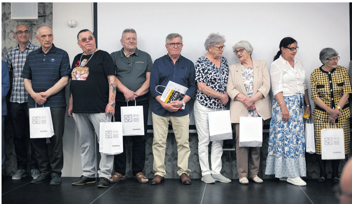
To między innymi oni są współtwórcami książki