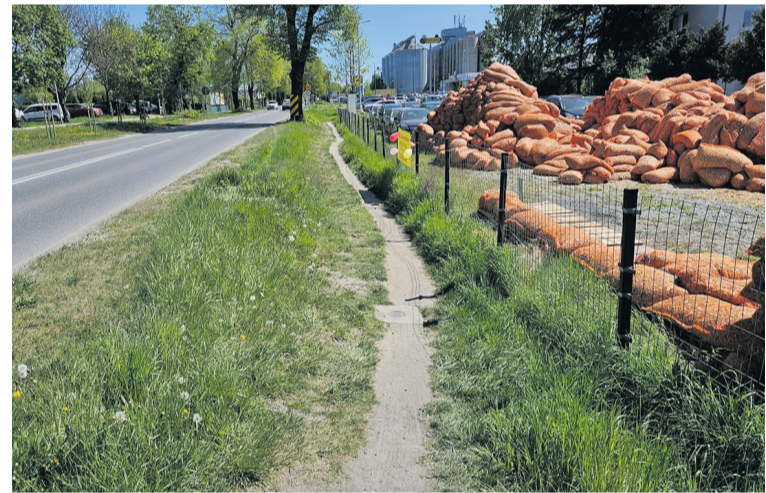
Chodnik w tym miejscu byłby bardzo praktyczny

- Na ulicy Krzywoustego panuje bardzo duży ruch samochodowy. Wystarczyłby krótki odcinek