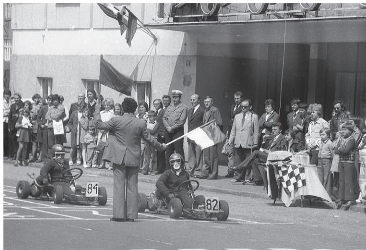
Zawody gokartów odbywały się w Rynku. Start - przy hotelu „Słask”