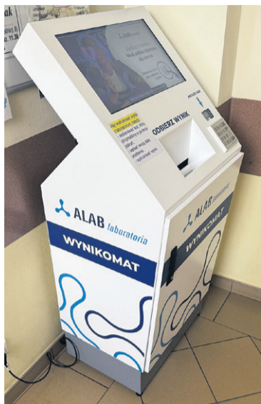
Pierwszy wynikomaty w powiecie

Aby samodzielnie wydrukować swoje wyniki z laboratorium, wystarczy wykonać trzy proste kroki: 1: Zeskanuj specjalny kod kreskowy, który otrzymałeś/aś od personelu w punkcie pobrania; 2: Wpisz na ekranie swoją datę urodzenia (w celu weryfikacji tożsamości i bezpieczeństwa danych); 3: