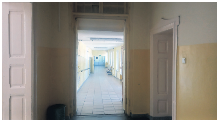
Za tymi drzwiami było pomieszczenie kaplicy szpitalnej do 1978 r., kiedy usunięto tą część, aby połączyć przejściem nową część szpitala ze starą