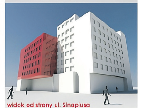
widok od strony ul. Śniapska (jadąc w kierunku ronda)