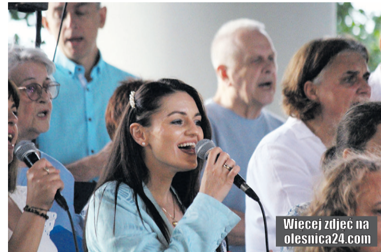
Zaśpiewali na chwałę Pana