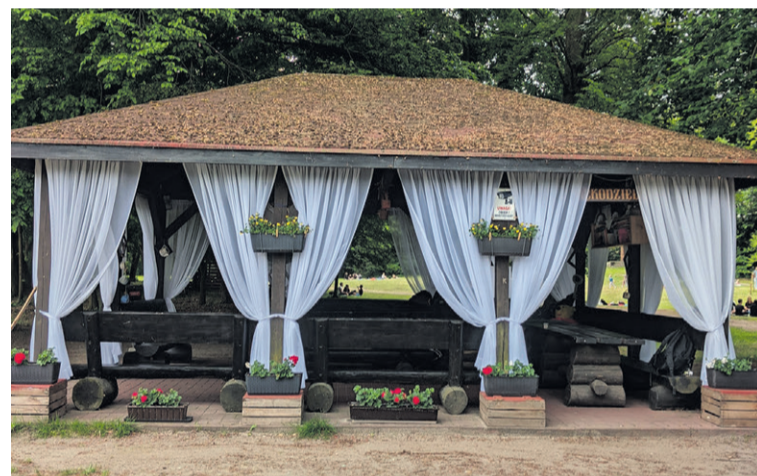
Miło będzie tu przysiąść

Nowa odsłona altanki została zaprezentowana w Dniu Dziecka, co sprawiło, że radość z tej inicjatywy była jeszcze większa. Dla wielu mieszkańców jest to sym-