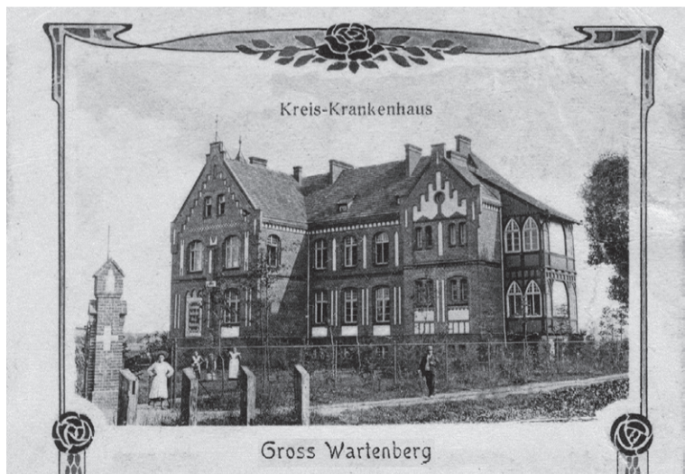
Na widokowce z 1903r. widać po prawej stronie szpitala jakby dobudówkę, w której na I piętrze była kaplica szpitalna