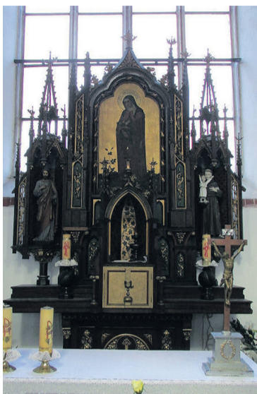
Ołtarz św. Elżbiety Węgierskiej z sycowskiego szpitala został przewieziony do kościoła Marii Magdaleny we Wrocławiu

Jak wynika z fragmentu historii parafii, było to zwińczenie konfliktu z władzami komunistycznymi. Już w maju 1962 roku na polecenie przewodniczącego PRN zakazano kapelanowi odprawiania mszy dla chorych. Gdy ksiądz nie podporządkował się zakazowi, został zwolniony. Nabożeństwa jednak nadal się odbywały. Ostatecznie w październiku 1963 roku ołtarz usunięto siłą. Kilka pracowników POM bez zgody proboszcza przewiozło go następnie do kościoła polsko-katolickiego we Wrocławiu.