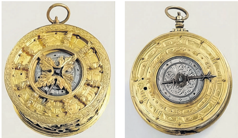
Zwykłe zegarki Hansa Pohla z ok. 1570 r. z muzeum w Ołomuńcu