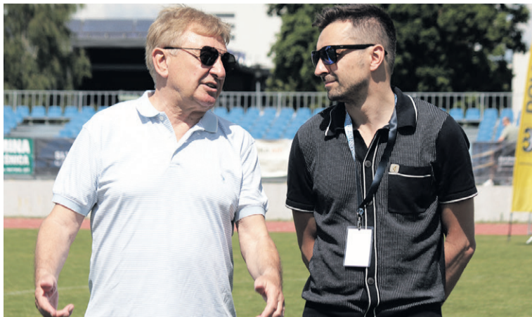
Mamiński i Pławgo - goście Memoriału