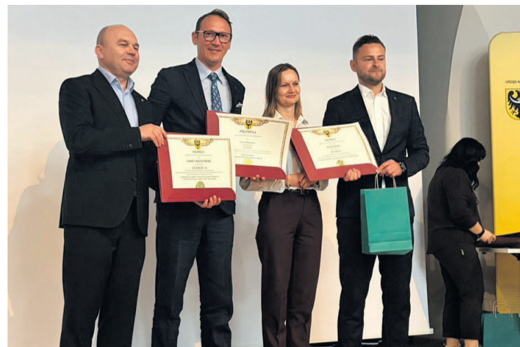
Dobra wiadomość dla gminy

Kolejna promesa, opiewająca na 20 tys. zł, dotyczy konserwacji i remontu urządzeń melioracji wodnych szczegółowych na terenie gminy. Prace mają przyczynić się do poprawy gospodarki wodnej