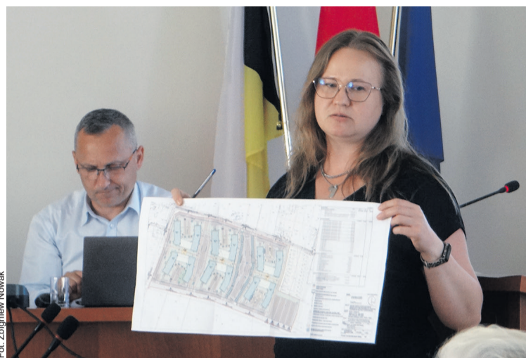
Łatwiej zaprojektować całe osiedle

- Biorąc pod uwagę niż demograficzny, pytanie, czy potrzebujemy nowych 600 mieszkań? – zauważyła Katarzyna Lamek-Pawłowska . - Młodzi ludzie, nawet jeśli są, to uciekają z Sycowa, ja też mieszkam tutaj tylko ze względu na męża, bo pracuję we Wrocławiu, a dojazdy zajmują mi półtorej godziny w jedną stronę – wyjaśniła. - Dużo działek stoi opuszczonych. Państwo nie obawiają się, że te wasze bloki też będą stały puste?