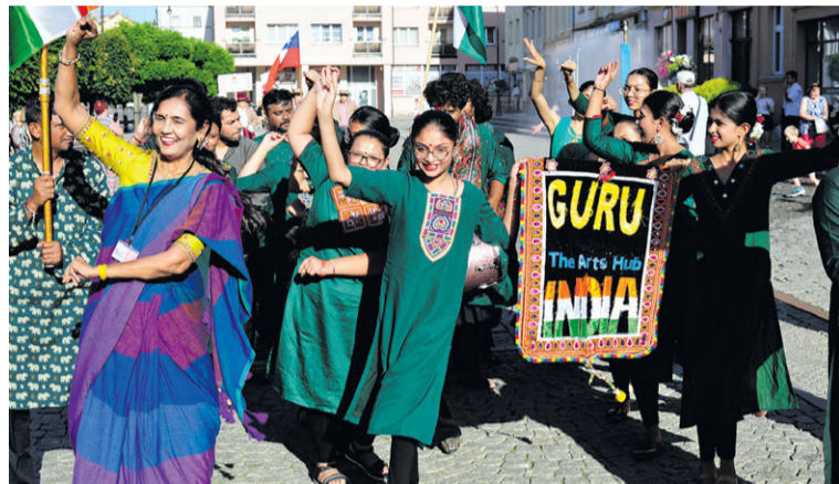
Indie zawsze rozpoznawalne