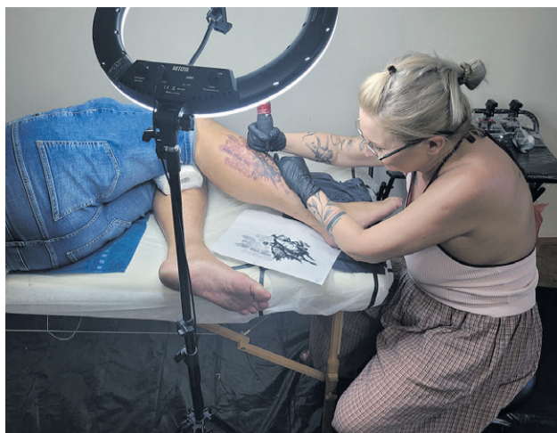
Będzie pamiątka festiwalu