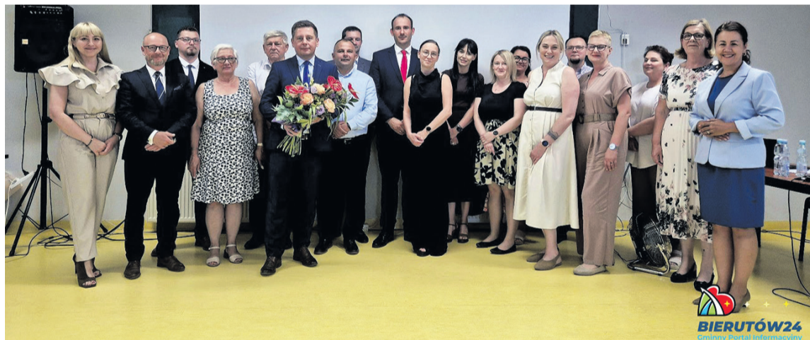
Satysfakcja dla wszystkich!

BIERUTÓW • Co wynika z raportu o stanie Bierutowa w roku minionym?