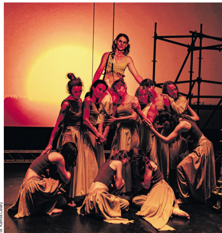
Opowieść o współczesnym człowieku

Mit stał się punktem wyjścia do opowieści o współczesnym człowieku - jego dorastaniu, relacjach i poszukiwaniu własnej drogi. To historia utkana z kontrastów: między młodością a dorosłością, wolnością a odpowiedzialnością, buntem a troską, kontrolą a potrzebą niezależności. Na scenie przenikają się dwa światy - młodzienna energia Ikarów oraz doświadczenie dorosłych, którzy