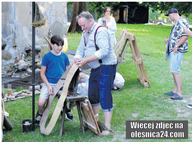
Pokażę ci, jak to kiedyś było