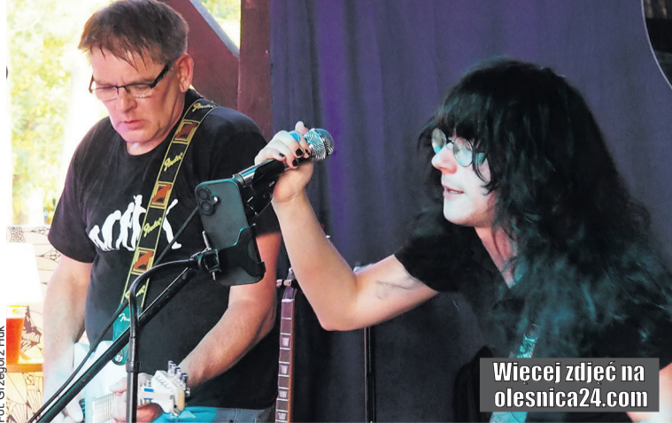
Blues i rock rozbrzmiał wśród lasów

Na festiwalowym plakacie widniało znamienne logo z ikoną dużego drzewa i napisem „Malerzów