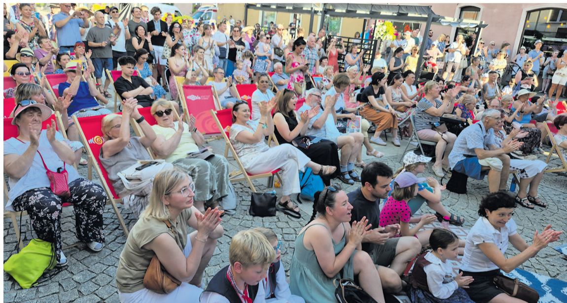
Publiczność dopisała, mimo upału