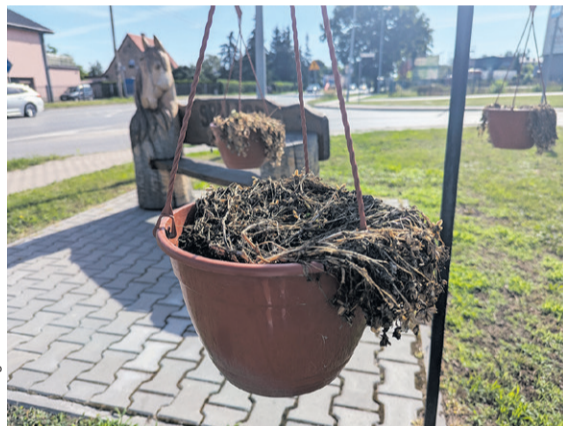
Już tylko szpeca

GINA OLEŚNICA • Jedni dbają, inni zapomnieli. Przy wjeździe do jednej z miejscowości widać wyraźny problem.