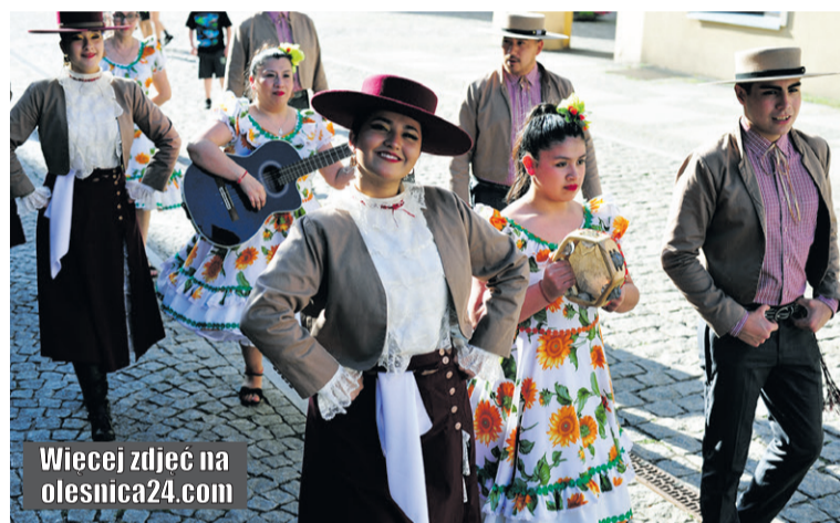
Wiecej zdjęć na olesnica24.com