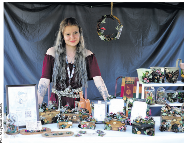
Wiedźmińska biżuteria? Proszę bardzo...