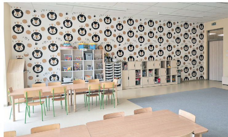
To miejsce dopracowane w każdym szczególe

Rekrutacja do przedszkola cieszy się dużym zainteresowaniem i odbywa się corocznie w okresie marzec-kwiecień. Wszystkie szczegółowe informacje dotyczące naboru publikowane są na oficjalnym profilu placówki na Facebooku oraz w Biuletynie Informacji Publicznej.