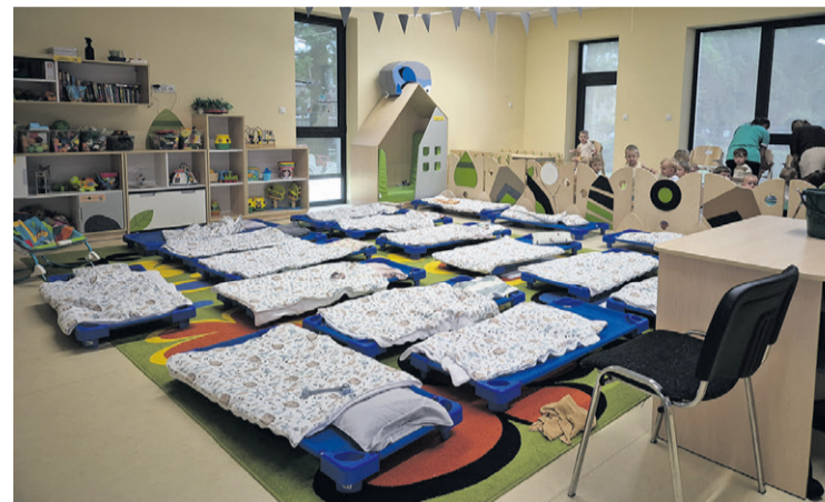
Leżakowanie odbywa się w komfortowych warunkach

Nowoczesne budownictwo, najwyższe standardy bezpieczeństwa oraz bogata, interaktywna oferta sprawiają, że Przedszkole w Bierutowie to miejsce dopracowane w każdym szczególe - od przestronnych wnętrz zaprojektowanych z myślą o komforcie dzieci, po innowacyjne metody nauczania, które angażują i zachwycają maluchy każdego dnia.