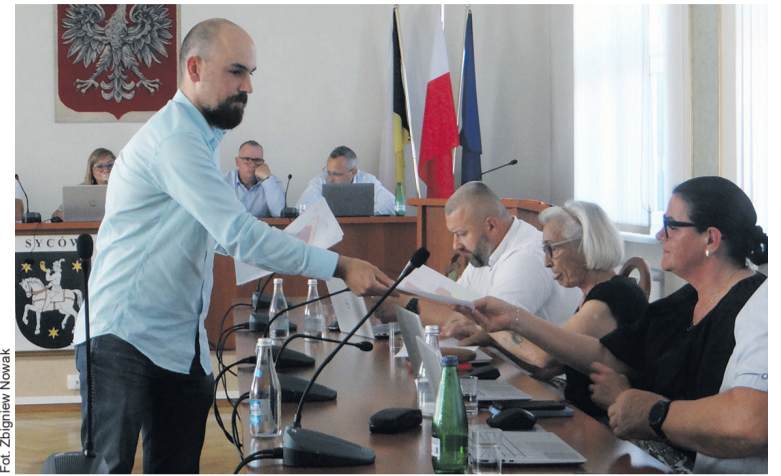
Radni otrzymali mapki

- Wyjaśnię, skąd cała ta zmiana naszych założeń – zaczął tłumaczyć prezes. - Po pierwsze, w przyszłym roku ma ruszyć budowa głównego punktu zasilania Syców-Wschód. Po drugie, dawniej istotnie plany zakładały 100