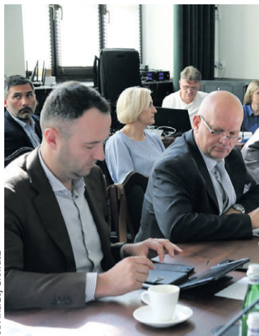
Najważniejsza sesja w roku

Gmina prowadziła cztery placówki oświatowe, do których uczęszczało 1460 dzieci i uczniów.