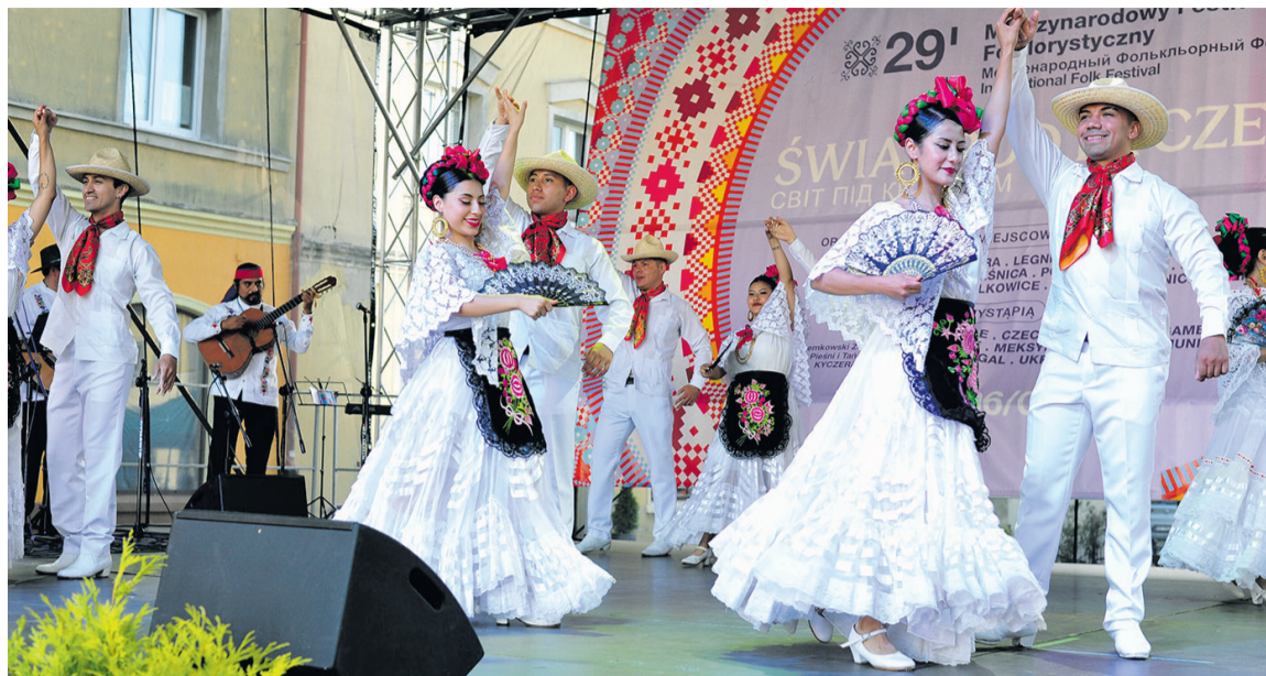
Było co oglądać i okłaskiwać