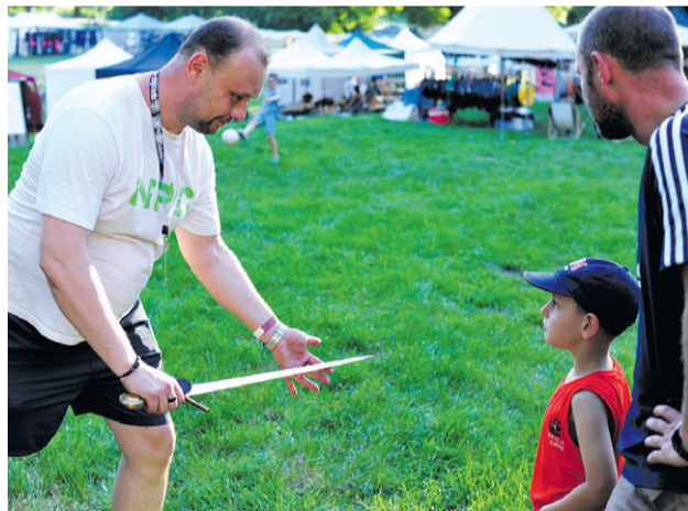
Możesz nim przeciąć kartkę papieru...