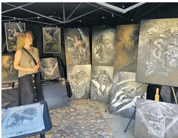
Zagościła tu sztuka