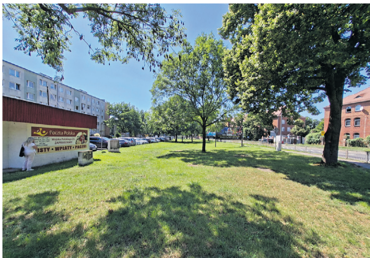
Miejsc parkingowych i drzew na Serbinowie przybędzie czy ubędzie ?...

Zielona wiata, parking i przystanek autobusowy. Tak zmieni się teren przy Wojska Polskiego.