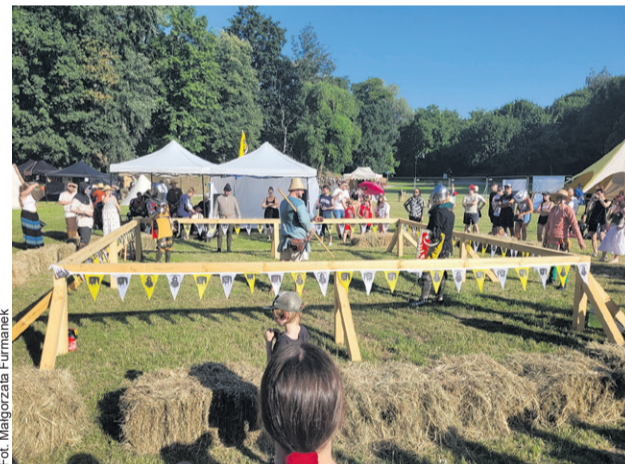
Średniowieczny gród wyrósł pod zamkiem