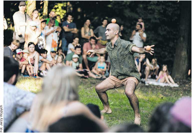
Rezerwujcie czas w sierpniu

Wise Fools: Hot & Cold - ulubienicy oleśnickiej publiczności wracają z nowym, pełnym hu-