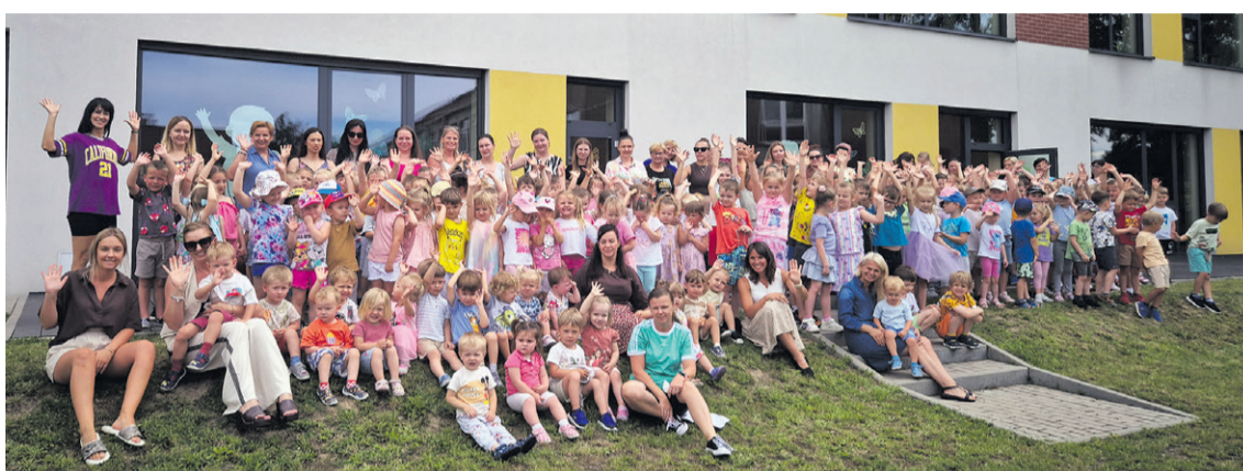
Do przedszkola uczęszcza 226 maluchów

Coraz więcej dzieci, coraz większe możliwości.